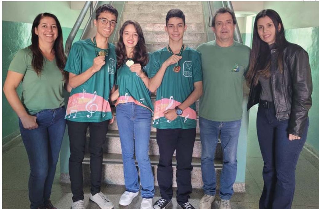
Alunos visitaram a escola Paraisense e foram recebidos pelo diretor e as professoras de matemática

Representando a Escola Estadual Paraisense, jovens viajaram até Florianópolis para receber a honraria