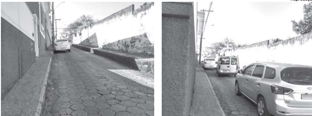
Por falta de sinalização adequada, veículo estacionado irregularmente no trecho estreito da Rua Capitão Pádua, provoca transtorno