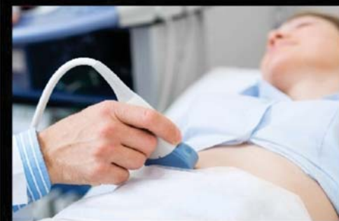
IMAGEM EXATA ULTRASSONOGRÁFIA

✓ CENTRO ESPECIALIZADO EM ULTRASSOM ✓ MEDICINA FETAL E SAÚDE DA MULHER