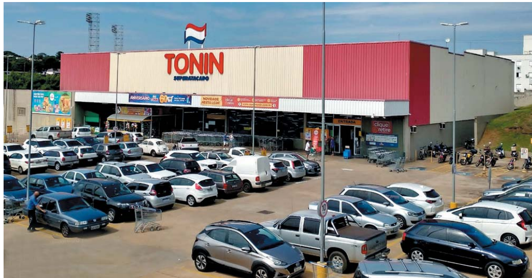
Rede Tonin é um dos maiores grupos do ramo de atacarejo do interior de São Paulo e Sudoeste de Minas Gerais

Troco Solidário abrangeu 18 filiais nos estados de São Paulo e Minas Gerais e beneficiou 14 instituições sociais