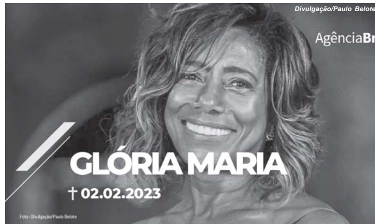
Por Akemi Nitahara Repórter da Agência Brasil Rio de Janeiro

Profissionais homenageiam ícone do telejornalismo, que morreu hoje