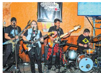
Banda Bendita e os Frutos no Original Chopp