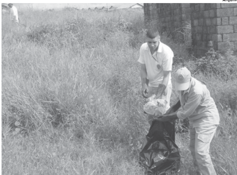
Terrenos e quintais sujos favorecem procriação do mosquito e podem causar epidemia de dengue em Paraíso

O trabalho consiste na adoção de medidas estratégicas das equipes da Vigilância principalmente nas regiões de maior concentração dos focos dos criadouros dos mosquitos. Existe um trabalho intenso sendo feito na Rua Desembargador Jorge Fontana onde foram detectadas áreas propícias para o desenvolvimento de focos do mosquito da dengue. Depósitos de água irregulares, vasos e frascos com água, garrafas retornáveis, recipientes de gelo em geladeiras; além de materiais em depósitos de construção, lixo, sucatas e ferro velhos, são alguns dos mais frequentes fo-