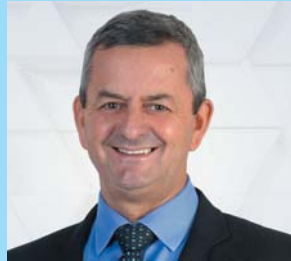
06/08 ANTONIO CARLOS ARANTES Deputado Estadual - 1º vice-presidente da Assembleia Legislativa MG

Este colunista cumprimenta com apreço e admiração esses profissionais que fazem a diferença em São Sebastião do Paraíso, em suas mais diversas profissões e segmentos. Externo minha admiração, consideração a todos vocês que carregam vasta experiência em suas áreas, sendo referências.