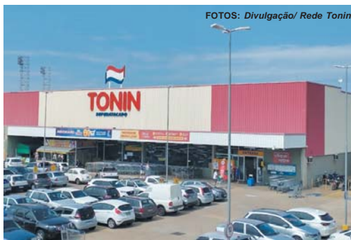
A Rede Tonin é uma das maiores redes de atacarejo do interior de São Paulo e Sudoeste de Minas Gerais

Novo canal de comunicação da marca traz todas as informações referentes à empresa