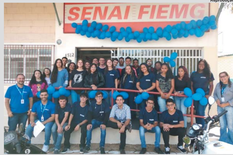
SENAI completou 11 anos da instalação de sua unidade em São Sebastião do Paraíso