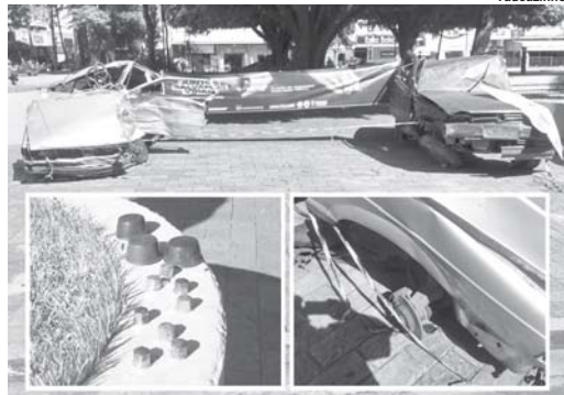
Veículos acidentados expostos na Praça Com. José Honório, o que está à esquerda teve duas rodas com os pneus furtados