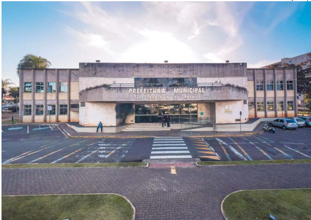
Objetivo da Administração é reduzir dívida para R$ 18 milhões até o final do mandato

Rede de postos cobra mais caro em Paraíso, que sua filial em Passos