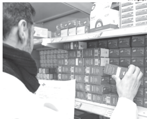
Melhorias na assistência em farmácia agilizará entrega de medicamentos de alto custo em Paraíso

Na justificativa do projeto apresentada pelo Executivo consta que a adesão a essa política prevê a concessão de incentivo financeiro para a estruturação do estabelecimento e custeio do serviço. O recurso terá como destino a aquisição de mobiliário, equipamentos e material de consumo. O prefeito argumenta que a abertura do crédito adicional especial necessária uma vez que a Lei Orçamentária Anual de 2022 não contemplou estes investimentos em sua elaboração. Além disso, o projeto também autoriza o Poder Executivo a suplementar as dotações de