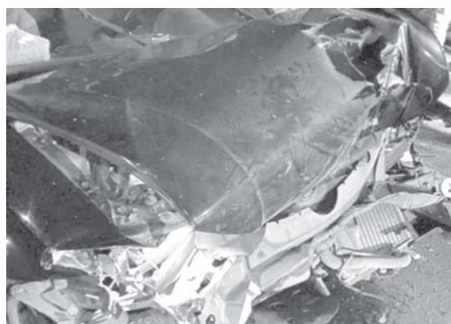
Acidente foi registrado na BR-491 próximo ao Terminal Rodoviário

Grave acidente de trânsito foi registrado em São Sebastião do Paraíso e atendido pelo Corpo de Bombeiros e do SAMU. O caso foi registrado por volta das 19h40 de domingo na BR-491, trecho próximo ao Terminal Rodoviário Angelo Scavazza. O motorista de uma Saveiro que colidiu contra a traseira de uma carreta precisou