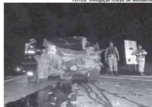
Com a colisão houve vazamento de óleo da Saveiro na pista

Segundo informações o veículo VW Saveiro colidiu contra a traseira de uma carreta que seguia no mesmo sentido. Com o impacto a Saveiro ficou parcialmente destruída e provocou derramamento de óleo na pista. Apesar do impacto o motorista da carreta continuou