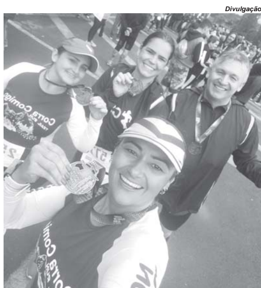
Integrantes da equipe Corra Comigo representaram Paraíso na corrida da Volta ao Cristo

Depois de um ano e meio ausente do calendário a prova voltou a ser realizada. O hiato se deu uma vez que em 2021 a corrida não foi realizada tendo em vista as restrições da pandemia da covid-19. Neste ano a prova que estava marcada para acontecer no final de janeiro chegou a ser adiada e acabou sendo remarcada para ocorrer em maio. E desta vez foi realizada mesmo com o tempo chuvoso, clima que acabou favorecendo os competidores.