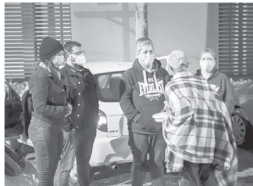
Equipe da Secretaria de Desenvolvimento Social vai abordar pessoas em situação de rua e encaminhá-las ao Albergue Noturno