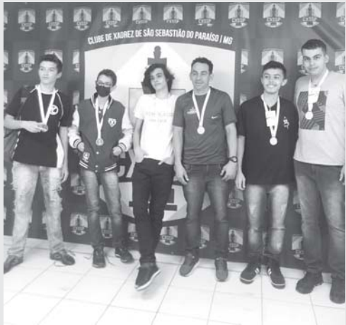
Premiação Módulo II Masculino

A etapa microrregional do Jogos Escolares de Minas Gerais - JEMG foi realizada, no dia 11.05.22, na cidade de São Sebastião do Paraíso - MG. A competição aconteceu no Clube de Xadrez - CXSSP, localizado na Arena Olímpica.