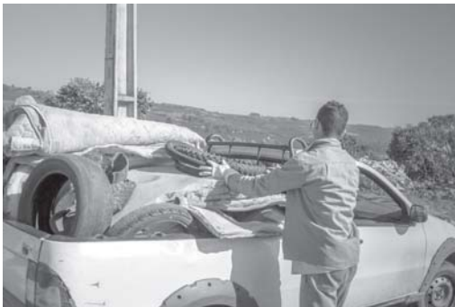
A Prefeitura removeu 9 caminhões de materiais que poderiam contribuir para o aumento da dengue