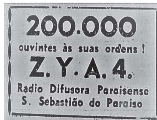
O Jornal. Rio de Janeiro, 26 de outubro de 1949

Ao final da apresentação, a dupla assinou o livro de visita da emissora fundada, em 1939, pelo empre-