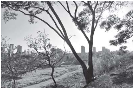
Paraíso debate na Câmara dos Vereadores mudanças e renovação na legislação ambiental