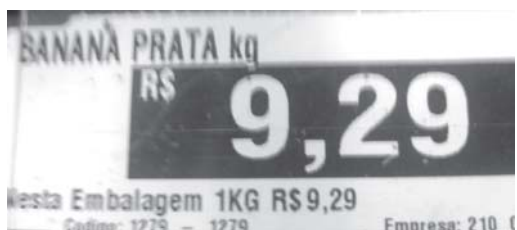
Cenoura custava no início do ano R$ 3,00, está custando R$ 9,29, aumento de mais de 200%, a banana prata custava em média R$ 3,50, está custando R$ 10,29, aumento de 160%