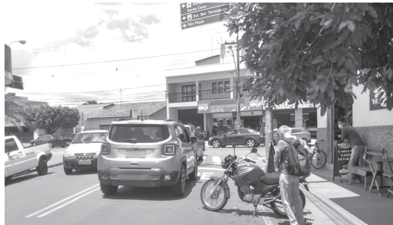
Entroncamento da Av. Delfim Moreira, com Av. Wenceslau Braz, está precisando de Semáforo

Condutor de veículos que transitam pela Av. Delfim Moreira e vai convergir à esquerda para acessar a Av. Wenceslau Braz, tem que ter