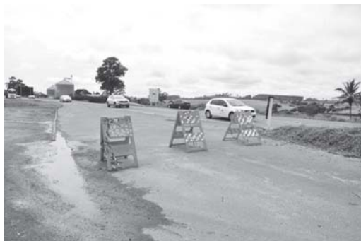
Trecho foi fechado por entupimento de galeria que forma poças de água na via lateral podendo provocar acidentes