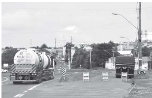
Passagem de carros e caminhões é feita por dentro do trevo sem prejuízos aos motoristas