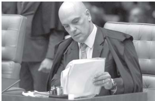
Brasília

Alexandre de Moraes, do STF, considerou trecho da lei inconstitucional