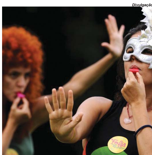
Número de registros de crimes contra a mulher aumentam consideravelmente durante os dias de Carnaval