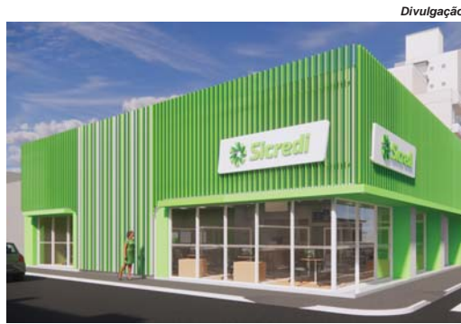
Projeto da nova estrutura do Sicredi em São Sebastião do Paraíso na Praça Comendador João Alves

"É com muita alegria que, após quase cinco anos do início das nossas atividades em