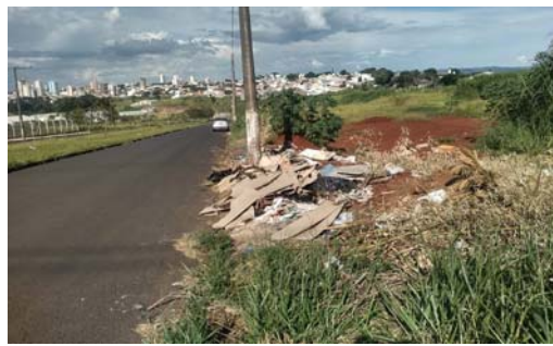
Av. João Pereira de Souza, uma das mais necessária e importante de Paraíso, está com enormes buracos dentro da pista e depósitos de lixo a céu aberto

A outra reclamação é referente a presença de enormes buracos dentro da pista deste referida e importante via pública perimetral onde é grande o fluxo de caminhões de cargas que vêm ou que vão destino a várias cidades e estados. Os bu-