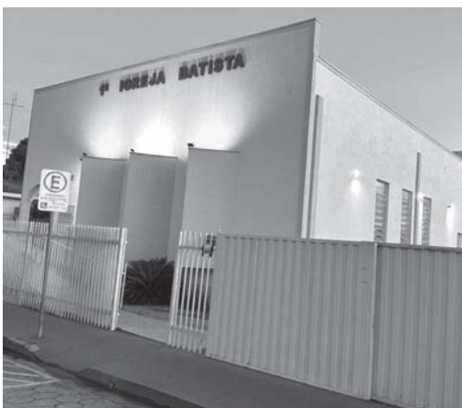
Primeira Igreja Batista em Paraíso realiza Curso de Teologia

A Escola de Teologia do Espírito Santo - Esutes em parceria com a Primeira Igreja Batista em Paraíso traz o Curso de Teologia. O Estudo Bíblico é de vital importância para o crescimento da Igreja de Cristo com a visão de fortalecer ainda mais o ensino da Palavra de Deus. O curso tem duração de 18 meses, um encontro presencial, sendo o último sábado do mês, das 9h às 16h30, no templo da Igreja. As aulas terão início em 23 de março de 2024, as matrículas estão abertas.