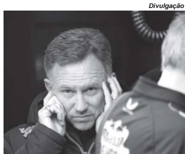
Christian Horner, chefe da Red Bull, investigado por conduta inapropriada

O indeferimento do pedido da Andretti tem como pano de fundo questões finance-