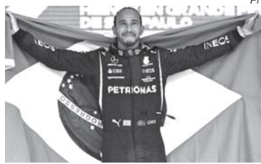
Lewis Hamilton: "Há um pouco de Brasil em mim"

Hamilton não precisa de marketing. Com 7 títulos mundiais de F1, recordista absoluto de pole positions e de vitórias (103 cada), tem história, fama e carisma suficientes para precisar fazer mídia. O que ele fez em Interlagos no ano passado ao desfilarem com a bandeira do Brasil depois de uma vitória épica, e subir ao pódio enrolado à bandeira, não foi para agradar ninguém ou conquistar torcida, e o que disse na palestra a respeito do Brasil não foi apenas para arrancar aplausos. No fundo, ele se sente confortável aqui, se sente em casa. Então, que seja sempre bem-vindo, Hamilton!