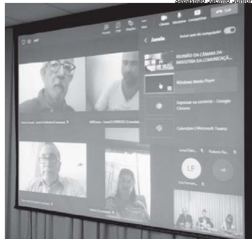
Reunião teve participação virtual de diretores de jornais, portais e emissoras de rádio de Minas Gerais