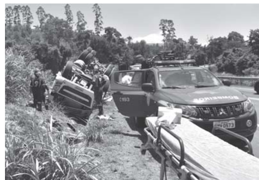
Socorristas do Samu e do Corpo de Bombeiros tiveram muito trabalho para retirar motorista das ferragens da carreta

Apesar da gravidade do acidente e das lesões sofridas pelo condutor, incluindo uma perna presa, ele se manteve consciente e orientado durante todo o processo de resgate. Sua condição era grave, mas estável, não correndo risco