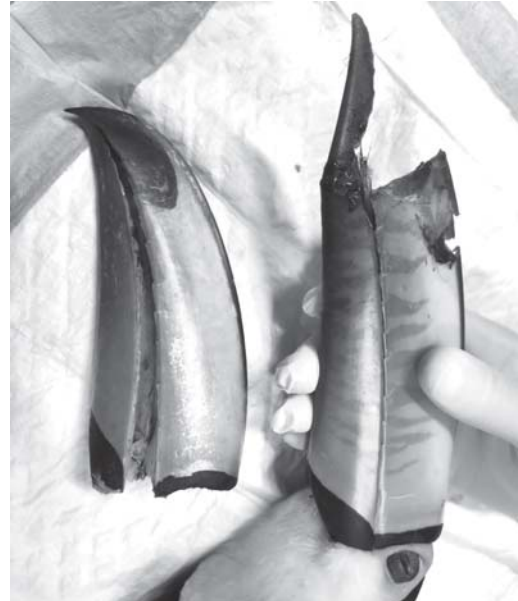
Uma prótese feita de resina e o bico de outro animal já falecido foi feita para a ave encontrada