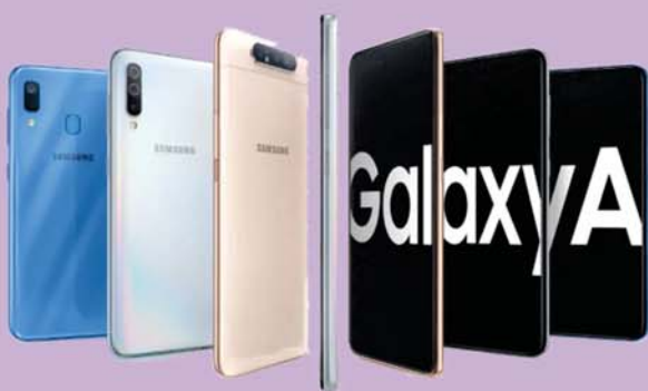
Samsung GALAXY A

NA INFOCELL CELULARES VOCÊ ENCONTRA TODA LINHA COMPLETA DE MARCAS, MODELOS E LANÇAMENTOS DE SMARTPHONES, TABLETS E ACESSÓRIOS PARA SEU CELULAR.