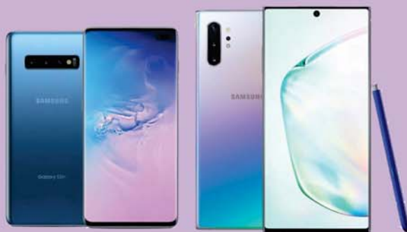
SAMSUNG Galaxy S10 MOCKUP PHONE