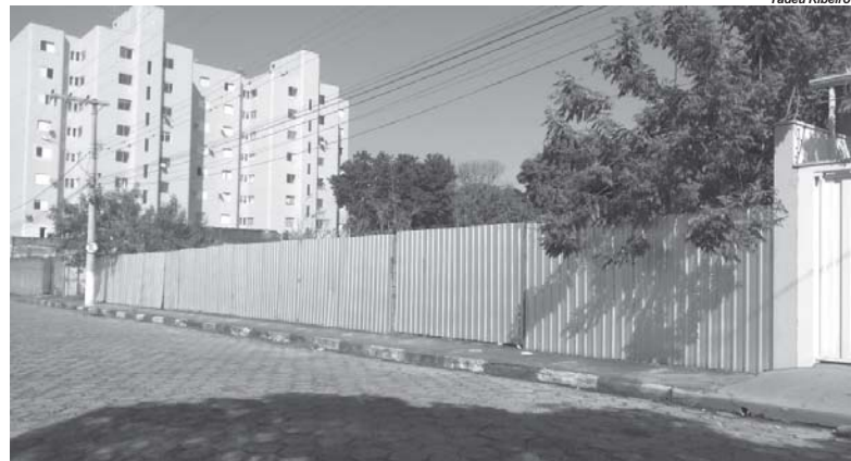
Nesta antiga obra inacabada e paralisada, está repleta de matos e ainda com lajes descobertas que acumula águas de chuva, preocupa vizinhança

ria e Zoonoses para que tomem as devidas providências para que essa irregularidade seja sanada.