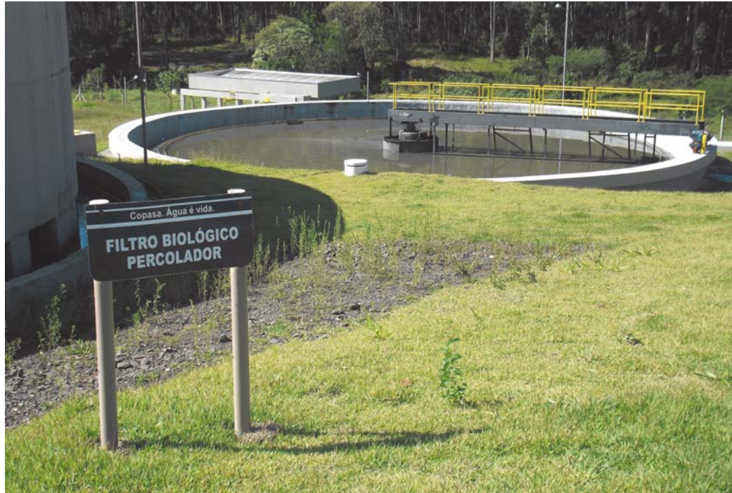
Cobrança pelos valores da coleta e tratamento do esgoto gerou toda a polêmica e motivou proposta de rompimento do contrato entre município e a Copasa

Grupo Líder Montanhas do Sudoeste realiza cerimônia de transbordamento