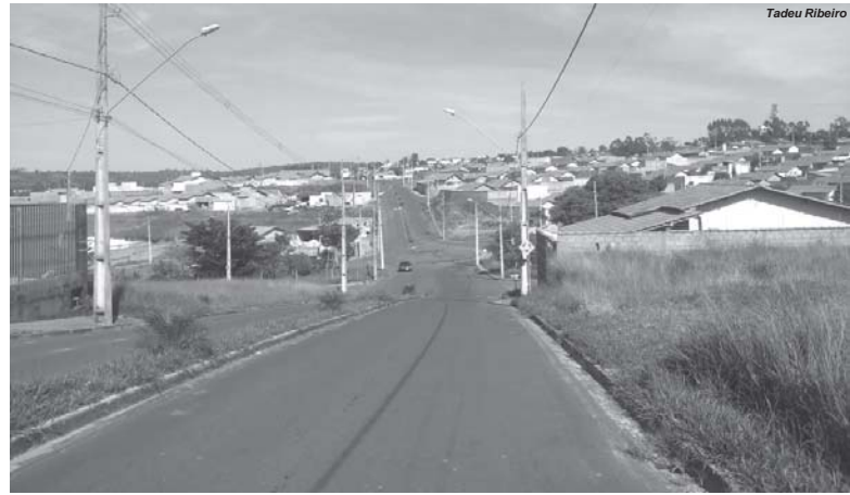
Várias denúncias ainda são feitas de venda irregular de casas populares no Parque Belvedere

Uma senhora afirmou que paga R$500,00 mensal de aluguel, trabalha e o seu salário não chega a R$1.500,00 —, e que passa o maior sufoco. “Já me cadastrei por diversas vezes para conseguir adquirir uma casa popular. O último cadastro que fiz foi para adquirir uma casa popular lá no Parque Belvedere, mas não consegui. Fico triste e revoltada porque muitas pessoas que adquiriram casa no Parque Belvedere, venderam ou trocaram a casa por outros objetos, moraram pou-