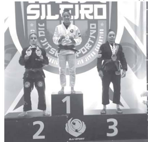
Atleta foi vice campeã em duas categorias

do no Ginásio Mauro Pinheiro. A disputa é considerada uma das maiores responsáveis pelo desenvolvimento da arte no país. Nesta edição também houve o recolhimento de alimentos não perecíveis junto ao público que serão repassadas a entidades sociais e beneficiará famílias carentes.