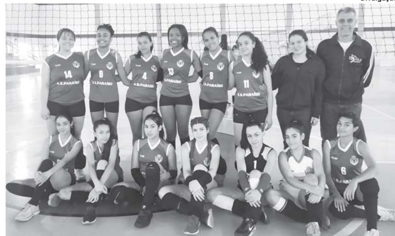
Meninas do voleibol paraense estrearam bem com vitória contra Barretos

"Estamos confiantes em fazer uma boa campanha. Es-