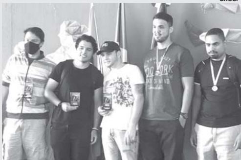
Araraquara, Serrana, Barrinha e São Sebastião do Paraíso estiveram no pódio da competição de xadrez

Foi realizada, no dia 26/06, a 4ª Etapa do Circuito Regional de Xadrez 2022, na cidade de Ribeirão Preto/SP.