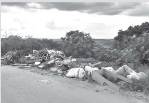
Inaceitável depósito de lixo de frente para a Rua Marcílio Braghini, no Alto Bela Vista e o matagal numa gleba de terreno vago na Rua José Luiz Filho, no Jardim Diamantina