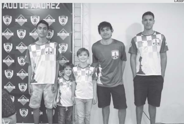
Representantes do Clube de Xadrez de São Sebastião do Paraíso

Aconteceu de 31 de maio a 2 de junho o Aberto do Brasil Contaud, na capital Mato-grossense.