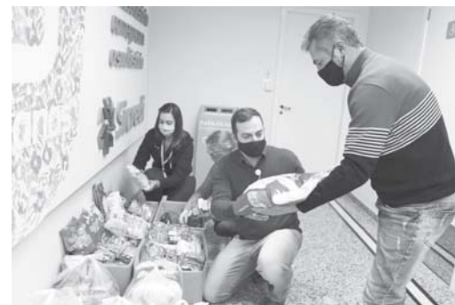
Em 2020 os alimentos arrecadados no Dia C foram destinados a instituições beneficentes na área de ação da Sicredi das Culturas

"O Dia C é mais um momento de união pela solidariedade, em que nos mobilizamos para contribuir e fazer a diferença nas comunidades em que atuamos. Em 2020, realizamos oficinas no nosso canal no