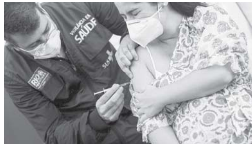
da Vacinação contra a Covid-19. O autor do PL, o senador

O projeto lista esse grupo nas prioridades do Plano Nacional de Operacionalização