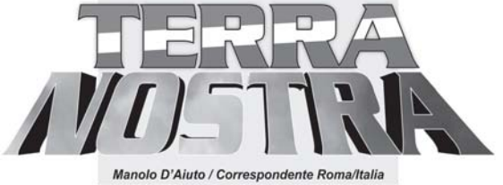
Manolo D'Aluto / Correspondente Roma/Italia