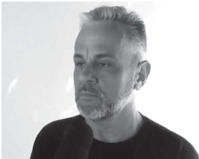
Morador disse que não teve tempo para sentir medo e agiu após ouvir celular tocar dentro da residência em chamas

Ao abrir a portinhola da residência, perceberam um veículo na garagem e imediatamente contataram os