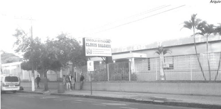
Clóvis Salgado é uma das escolas que oferece ensino de tempo integral em Paraíso