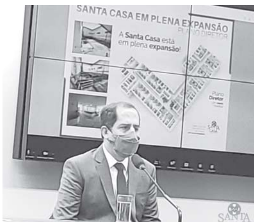
Na Câmara Federal, o provedor da Santa Casa participou da reunião da bancada mineira quando falou dos projetos do hospital