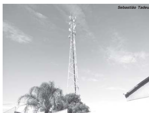
Torre de telefonia celular localizada na rua Rita Borges Libório, Jardim Vitória II, a luz de sinalização vermelha não está funcionando durante a noite

Alertamos a Secretária Municipal de Transporte, Trânsito, Segurança e Defesa Civil de São Sebastião do Paraíso, para que fiscalize e tome providências referente este problema que existe nos seguintes locais: na Av. Wenceslau Braz próximo a Santa Casa de Misericórdia tem uma torre de internet em que a luz vermelha está sem funcionar há muito tempo. Na rua Rita Borges Libório, no Jar-