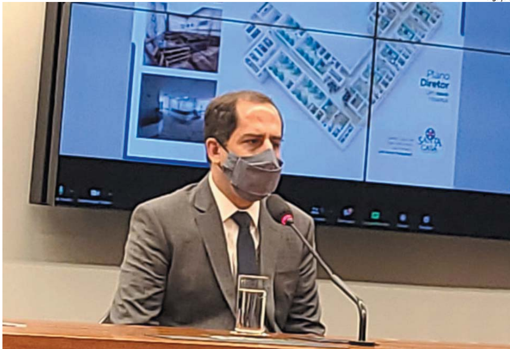
Na Câmara Federal, o provedor da Santa Casa participou da reunião da bancada mineira quando falou dos projetos do hospital