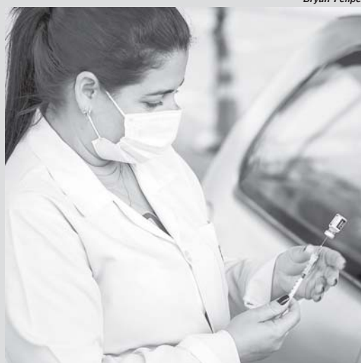
Avanço da vacinação na população ajudou a reduzir internações e zerou mortes por covid-19 há um mês

Em relação a São Sebastião do Paraíso até o dia 25 de setembro havia 276 casos. A última morte registrada na cidade em função da Covid-19 foi no dia 27 de setembro elevando o total de óbitos para 277. Em seguida,