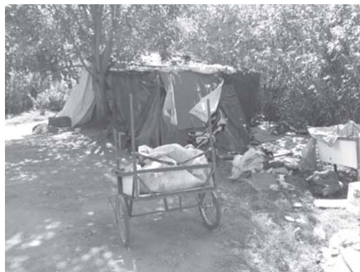
Sem teto mora precariamente num barraco montado de lona plástica bem ao lado da mina D'água Chico Targino

A reportagem do "JS" foi até o local e bateu papo agradável e até emocionante com o