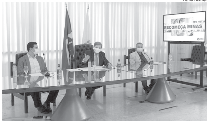
Empresários pediram a intermediação da Assembleia junto ao Executivo estadual e à Prefeitura de BH, para que o setor seja socorrido

O presidente da Assembleia informou aos empresários que uma de suas principais reivindicações, relativa a um programa de renegociação de dívidas tributárias estaduais, já integra o Plano Recomeça Minas, elaborado pelo Parlamen-