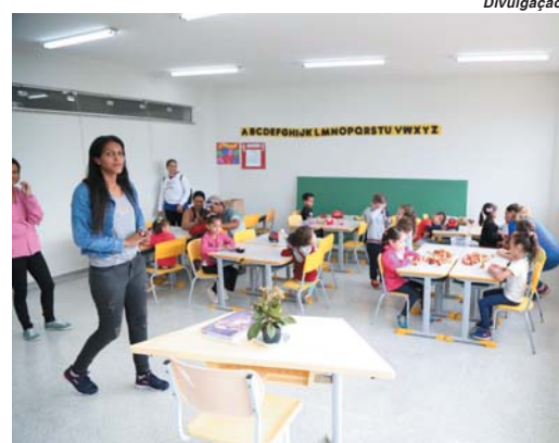
No primeiro dia de atividades no ambiente escolar recepção foi realizada com atividades de acolhimento às crianças e aos pais

Segundo informações da Secretaria Municipal de Educação, as crianças matriculadas nos Centros Municipais de Educação Infantil já haviam iniciado as atividades em 24 de janeiro. Nestes locais são atendidos cerca de 1.500 alunos com idade de 6 meses a 3 anos e 11 meses. Na última