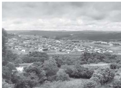
Denúncias de vendas irregulares de casas populares no Parque Belvedere, continuam sendo feitas

Se o contemplado que passou a ser proprietário vende a casa popular sem obedecer o prazo estipulado, sem dar a