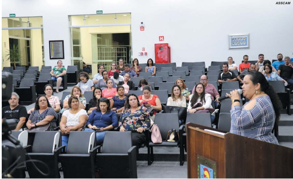
Secretária do SEMPRE relembra luta do Sindicato para conquista da lei, que data de 12 anos