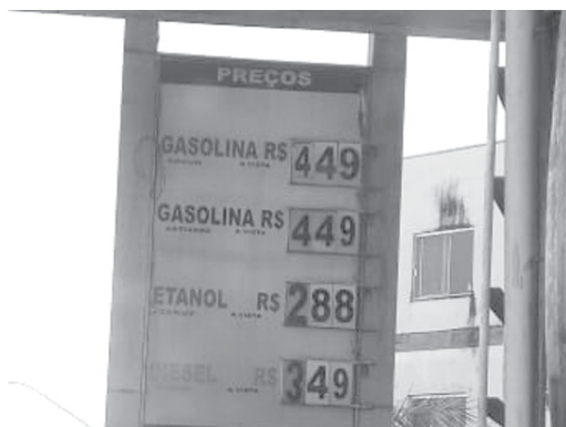
Preços de combustíveis nesta sexta (7/2), no Posto JPS em Passos, bem mais barato do que o posto da mesma rede em Paraíso

No Posto Paraíso, o condutor ou proprietário fazendo cadastro, basta informar o CPF e colhida sua digital, haverá o desconto de R$ 0,20 no preço