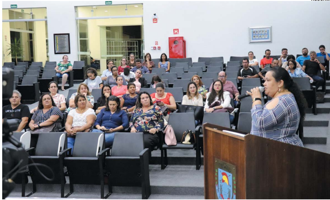
Secretária do SEMPRES relembra luta do Sindicato para conquista da lei, que data de 12 anos