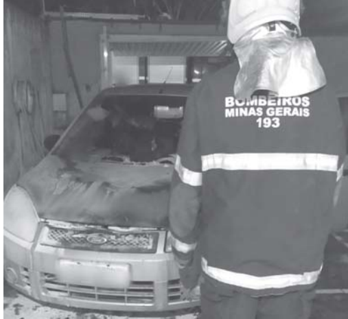
Bombeiros encontraram garrafa com resquícios de combustível na garagem onde veículo estava estacionado

Durante as diligências, Corpo de Bombeiros encontrou indícios de que a causa dos incêndios que destruíram os dois veículos foi criminoso