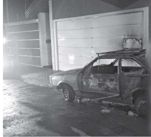
Com a ajuda da PM, populares apagaram o fogo que destruiu o Corcel no centro de São Tomás

Durante as diligências, os bombeiros encontraram vários indícios de que o incêndio teve origem criminoso: na calçada em frente à casa do proprietário havia um tijolo amarrado a uma linha; na garagem foi localizada uma garrafa pet de 2 litros com cheiro característico de combustível; já no interior do veículo existia uma