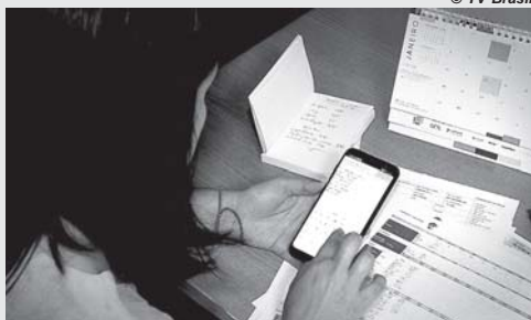
Por Agência Brasil SÃO PAULO

Iniciativa é da CVM, Sebrae e Ministério da Educação