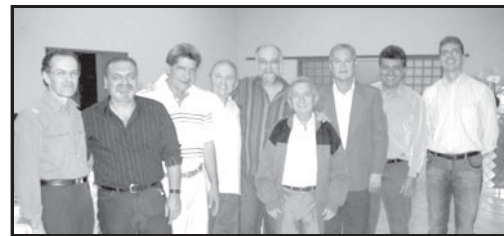
Corpo Clínico da Cemed em 2007