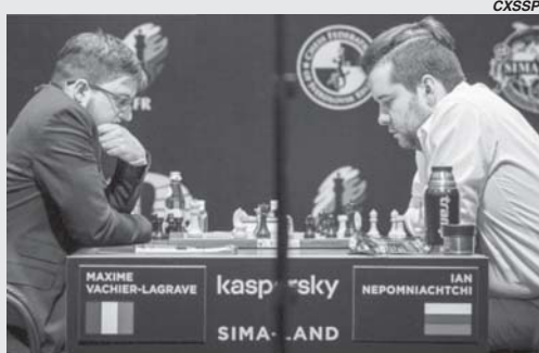
Torneio de Candidatos ao título de campeão mundial

O Torneio de Candidatos é o evento bienal de 8 jogadores que decide quem será o desafiador ao título de Campeão Mundial de Xadrez, que atualmente pertence ao Norueguês Magnus Carlsen. O campeonato (que estava pa-