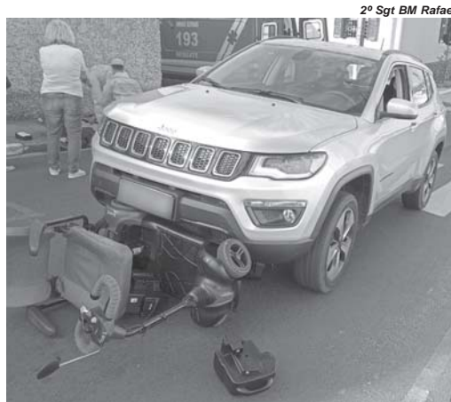
Cadeirante atingido no cruzamento da Geraldo Marcolini com a Delfim Moreira foi encaminhado a UPA

Segundo informações obtidas pela reportagem o acidente envolveu um veículo Jeep Compass que seguia pela rua Geraldo Marcolini em direção a praça Comendador João Alves. O