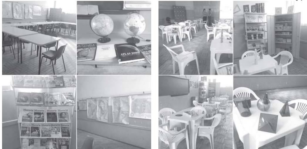
Sala Temática de “Ciências Humanas e suas Tecnologias”