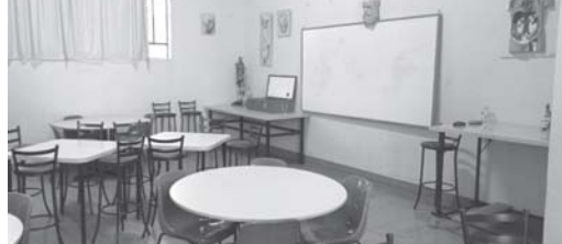
Sala Temática de “Ciências da Natureza e suas Tecnologias”

gos matemáticos, jogos históricos, documentos e inclusive obras de arte.