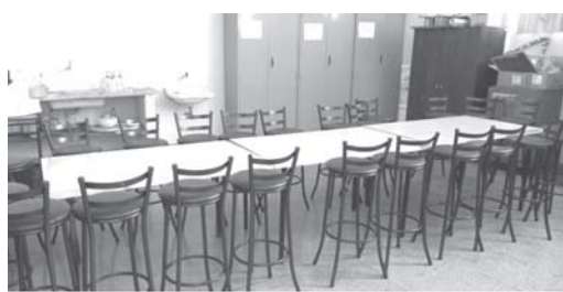
Sala Temática de “Ciências da Natureza e suas Tecnologias”

A metodologia de “salas temáticas” é muito utilizada em escolas e colégios renomeados, é um termo utilizado para chamar uma sala de aula especialmente montada para uma das grandes áreas. As “salas temáticas” proporcionam aos jovens e adolescentes do Ensino Médio em Tempo Integral um ensino mais dinâmico e menos cansativo, permitindo que os educandos tenham mais acesso a materiais que facilitam o estudo: mapas, microscópio, objetos geométricos, jo-