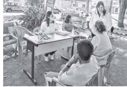
Projeto acontece ao longo do ano em diferentes pontos da zona urbana e rural

A Prefeitura de São Sebastião do Paraíso, por meio da Secretaria Municipal de Desenvolvimento Social (SMDS) e do Centro de Referência de Assistência Social (CRAS), iniciou na semana passada o projeto “CRAS na Praça”. A ação foi iniciada pela Praça da Vila Formosa.