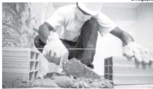
Construção civil foi o setor com melhor desempenho no mês de março, na geração de empregos em Paraíso

São Sebastião do Paraíso registrou em março saldo negativo em relação a geração de empregos com carteira assinada. Conforme dados divulgados pelo Novo Cadastro Geral de Empregados e Desempregados (Novo Caged), do Ministério da Previdência a quantidade de desligamentos foi maior em 33 casos do que os de admissões. O setor da indústria com 230 casos foi o que mais dispensou e o que mais contratou entre os cinco grupos avaliados. A construção civil foi a área que apresentou melhor resultado no período com saldo positivo de 26 vagas.