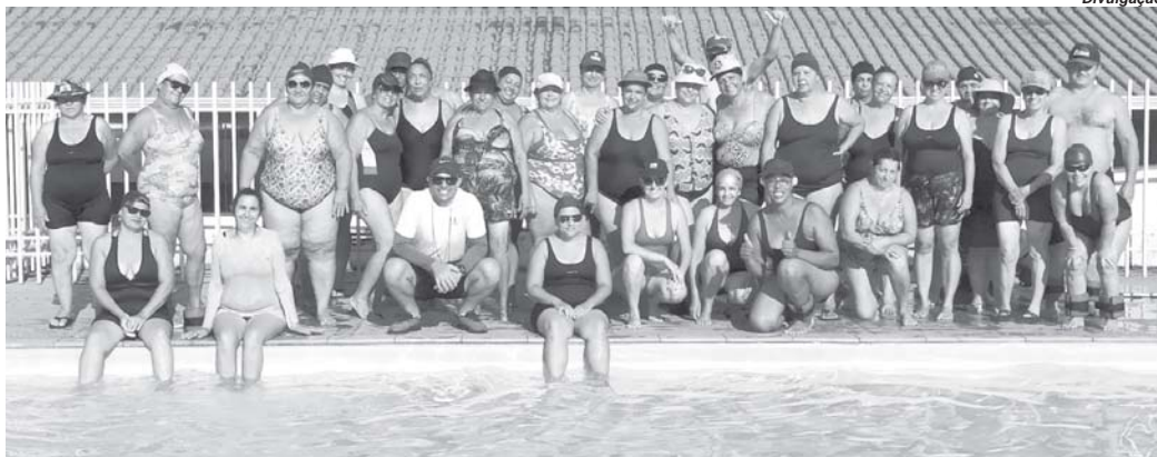
Hidroginástica recebe número recorde de participantes e possui fila de espera, tamanha a procura pelo projeto