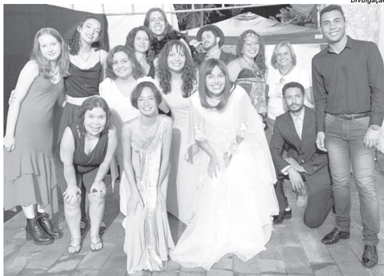
Peça sobre "Maria Engomada" encenada em 2021 teve 90% dos ensaios realizados de forma remota

O diretor teatral anuncia que os interessados já podem se inscrever. "Nosso Curso Livre de Teatro tem início na