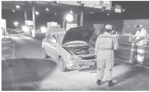
Incêndio no Corsa foi controlado por funcionários da concessionária

Duas ocorrências envolvendo incêndios em veículos foram registradas pelo Corpo de Bombeiros entre sábado e domingo. O primeiro caso foi na noite de sábado, 30, no pedágio da MG-050 e foi controlado por funcionários da concessionária. Outro caso foi registrado no final da noite de domingo, 1º de maio, na rodovia BR-265, sentido a Jacuí, onde uma Montana ficou totalmente destruída.