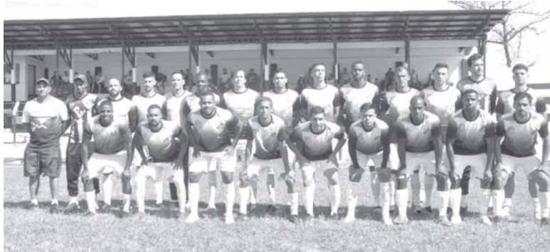
Depois de dois anos o Operário começou com vitória a temporada de 2022, contra o Clube Atlético Cruz das Posses