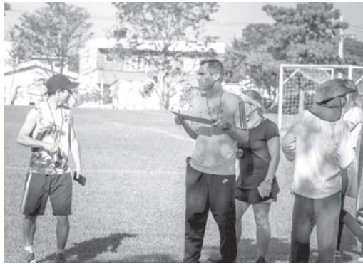
Expectativa é que pelo menos 250 alunos da Rede Estadual de Paraíso participem dos jogos