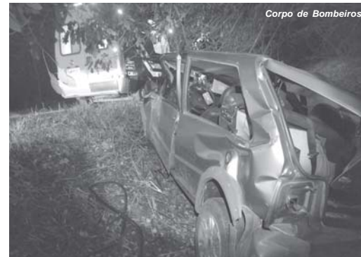
Idosa foi encontrada morta após acidente na Rodovia LMG-836

Conforme informações do veículo trafegava sentido a São Tomás. Após uma curva o condutor teria perdido o controle da direção e saiu da pista de ro-