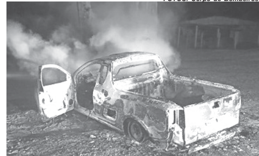
Montana ficou totalmente destruída pela ação do fogo

Já no final da noite de domingo, 1º de maio, por volta de meia noite, um incêndio em uma GM Montana mobilizou o Corpo de Bombeiros. A ocorrência foi registrada a aproximadamente 10 km de Paraíso sentido a Jacuí, na BR-265. Quando os bombeiros chegaram, o veículo já estava completamente destruído pelas cha-