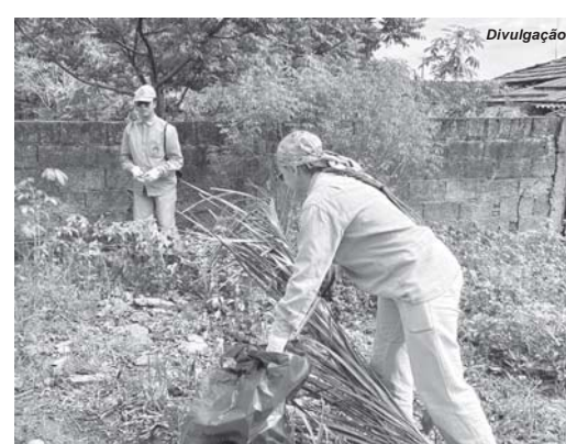
Ações de combate e controle a proliferação do mosquito Aedes aegypti vem sendo realizada ao longo do ano

Conforme levantamento divulgado pela SES/MG (Secretaria de Estado da Saúde de Minas Gerais), o estado registrou 88.050 casos prováveis (casos notificados exceto os descartados) de dengue. Desse total, 66.601 casos foram confirmados para a doença. 63 óbitos foram confirmados pela doença em Minas e 18 óbitos são investigados até o momento.