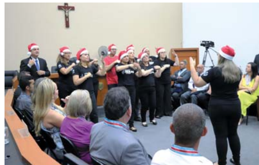
Apresentação do Coral em Libras