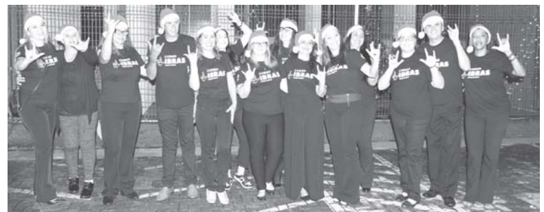
Apresentação do Coral em Libras