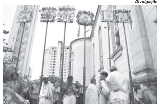
Solenidade de Levantamento das Bandeiras inicia parte religiosa da festa da Congada em Paraíso