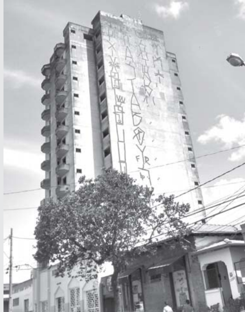
Pichadores aventureiros, praticaram vandalismo pichando as paredes deste prédio inacabado, no centro de Paraíso