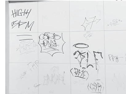
Quatro pichadores pegos em flagrante foram encaminhados à delegacia de Polícia Civil junto com material apreendido

Na madrugada de segunda-feira, 6 de junho, uma patrulha da Guarda Municipal, de São Sebastião do Paraíso realizou a apreensão de quatro menores.