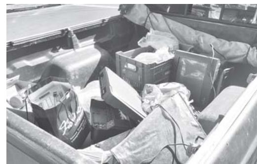
Materiais elétricos e eletrônicos serão recolhidos nas escolas pelos alunos participantes da campanha

Entre os resíduos que podem ser coletado estão todos os objetos que apresentam bateria ou que pode ser ligado na