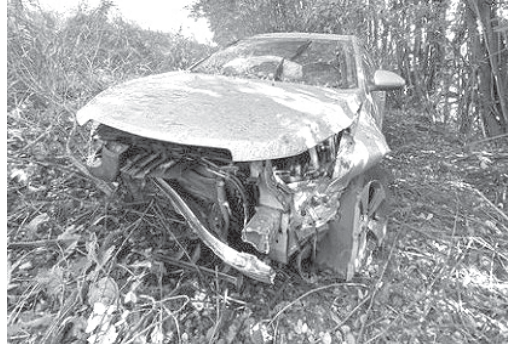
Veículo GM Cruze ficou com a frente destruída, mas as vítimas aparentemente não se feriram

O resgate do 2º Pelotão do Corpo de Bombeiros de São Sebastião do Paraíso foi acionado para o atendimento a um acidente de trânsito ocorrido na manhã de sábado, 4, na LMG-836, a Rodovia Pedro Luiz Cerize. Segundo informações um veículo GM Cruze teria tombado entre Paraíso e São Tomás de Aquino e havia duas vítimas. No local os ocupantes do veículo dispensaram atendimento.