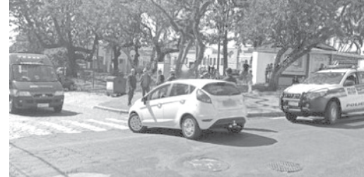
Colisão ocorreu no cruzamento da Rua Pimenta de Pádua com Travessa Ananias Alves Ferreira, na Praça São José

Um adolescente de 16 anos ficou ferido após uma colisão de trânsito na região central de São Sebastião do Paraíso. A ocorrência foi registrada no período da manhã de segunda (6), no cruzamento entre a Rua Pimenta de Pádua e a Travessa Ananias Alves Ferreira.