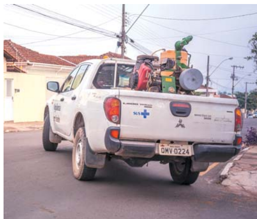
Carro do fumacê ficará 10 dias no Município

A Vigilância em Saúde pede à população que fique atenta às redes sociais do Município para se manter informada quanto ao cronograma e horários em que o carro passará pelo bairro. Entre as orientações, é importante que deixe toda a casa aberta como janelas, portas e cortinas; recolha utensílios