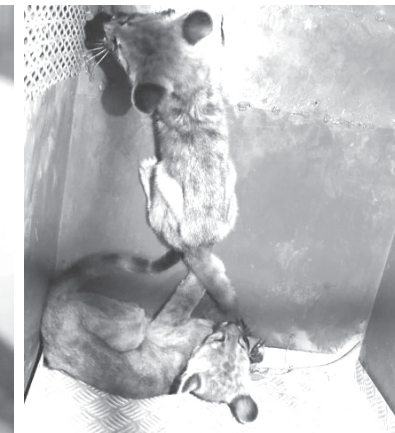
No intervalo de três dias quatro animais de três espécies foram capturados pela Unidade de Salvamento

Bombeiros pelo telefone 193 e afaste pessoas e outros animais, principalmente cachorros.