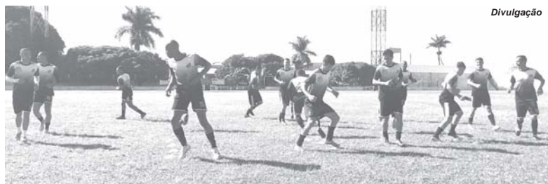
Operário jogará partida decisiva no domingo contra o Cruz das Posses no encerramento da primeira fase do Campeonato Regional

Já no segundo tempo os visitantes surpreenderam os donos da casa e em rápida decisão o atacante Ferrari aproveitou bem e fez 1 a 0 para o Tonin Cobra, aos dois minutos. Logo em seguida aos cinco minutos