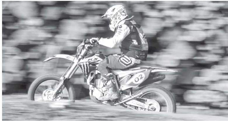
Piloto de Paraíso tem alcançado excelentes resultados na temporada deste ano e lidera categoria no Rally Baja

cine participou de mais uma etapa, a terceira do Brasileiro de Rally Baja de 2022. E foram disputadas intensas em quase 300 quilômetros de percurso total. De acordo com a organização foram quatro voltas de disputas acirradas, em dois dias de provas, totalizando pouco mais de 287 quilômetros (71,92 por trecho), sendo 221 deles em especiais (55,2 em cada prova).