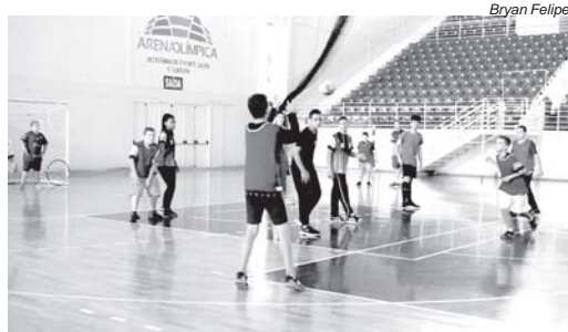
São diversos projetos que aos poucos estão sendo ampliados para atender a um público maior

A Secretaria Municipal de Esporte e Lazer de São Sebastião do Paraíso, tem ampliando projetos esportivos no Município e, hoje, atende a cerca de 900 alunos nas mais diferentes categorias, entre elas futebol, vôlei, natação, judô, ginástica rítmica entre outras. Os alunos têm se destacado em competições realizadas na região, inclusive, se tornando líderes em suas categorias.