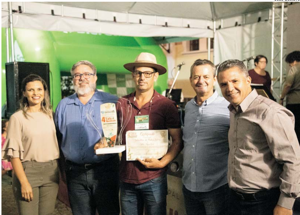
Premiação do Concurso Qualidade "Paraíso dos Cafés Finos" ocorreu ontem a noite na Casa da Cultura