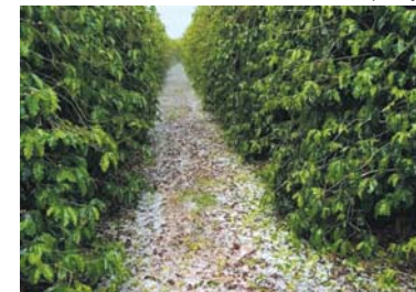
Estimativas apontam prejuízos em 10% das lavouras no município após as fortes chuvas de granizo do começo de semana

A Empresa de Assistência Técnica e Extensão Rural de Minas Gerais (Emater-MG) está fazendo um levantamento das áreas atingidas pelas fortes chuvas de granizo registradas no estado no início da semana. As lavouras mais prejudicadas estão nas regiões da Zona da Mata, Alto Paranaíba e Sul de Minas. As tempestades ocorreram nos dias 7 e 8 de novembro, causando prejuízos aos produtores rurais, principalmente aos cafeicultores. Em São Sebastião do Paraíso em uma prévia estima-se que os danos tenham afetado 10% da área plantada atingida com danos mais agressivos.