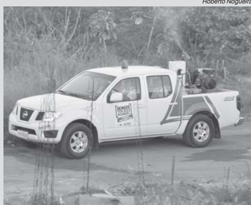
Município terá recurso extra do Estado para combate a dengue

O governador Romeu Zema decretou Situação de Emergência em Saúde Pública nos municípios de abrangência das Macrorregiões de Saúde Centro, Noroeste, Norte, Oeste, Triângulo do Norte e Triângulo do Sul do Estado. A partir dessa ação, que foi publicada, dia 24 no Diário Oficial Minas Gerais, será possível mobilizar recursos de forma mais ágil para enfrentamento do Aedes ae-gypti e estruturação de serviços de atendimento às pessoas infectadas pelo vírus causador da doença. A Secretaria de Saúde de Minas Gerais (SES-MG) destinou R$ 4,180 milhões, após aprovação da Re-