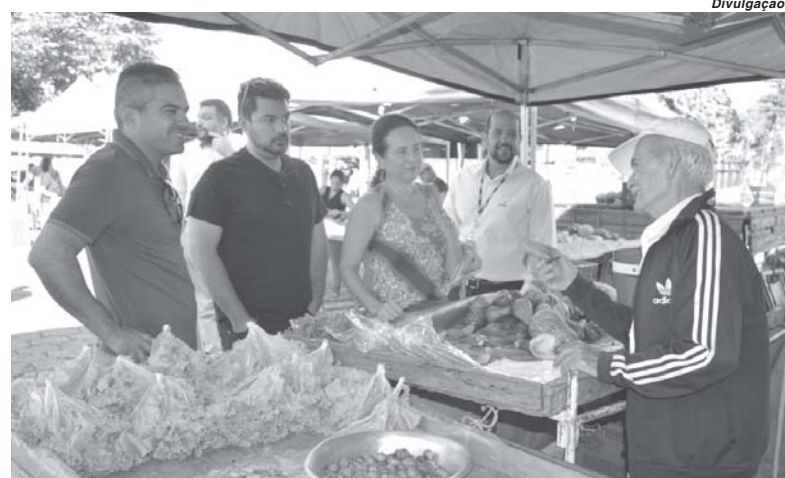
Pesquisadores estiveram na cidade e visitaram feiras, escolas e outros locais para conhecer as origens da comida de Paraíso

São Sebastião do Paraíso poderá fazer parte do Circuito Primórdios da Cozinha Mineira, do Serviço Nacional de Aprendizagem Comercial (Senac). O programa tem como objetivo mapear, resgatar e preservar os hábitos, técnicas e produtos alimentares dos primeiros habitantes de Minas Gerais.