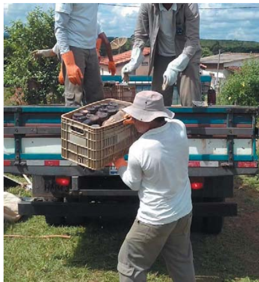
Município terá recurso extra do Estado para combater a dengue

"Temos percebido uma diferença muito grande do município em relação ao restante do estado, onde parece haver um aumento da doença enquanto que em Paraíso tem havido diminuição, temos seguido nesta contramão. Tivemos um pico muito alto de notificações