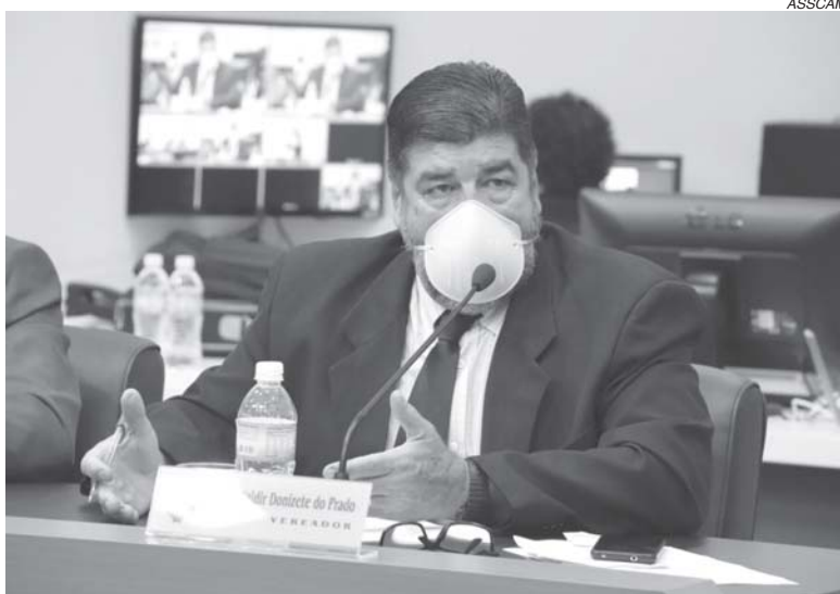
Vereador destacou probabilidade de atendimentos que antes eram presenciais passarem a ser somente online

"Concentramos também nossos esforços para captar novos empregados a este novo momento de forma a oferecer um atendimento mais ágil, eficiente e assertivo. Em tempo, a Copasa reitera que o protocolo de retorno dos empregados criado pelo comitê multidisciplinar do combate ao Covid prevê a retomada de