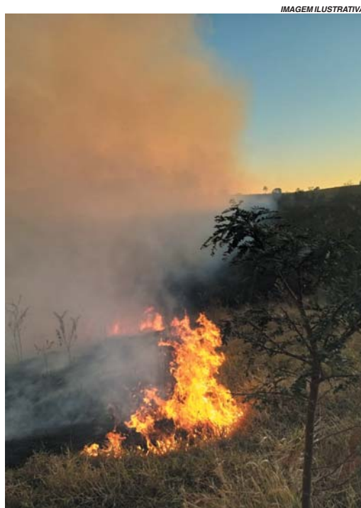
Colocar fogo intencionalmente é crime, com previsão de prisão e multa por crime ambiental

Bombeiros começaram a trabalhar no combate ao incêndio.