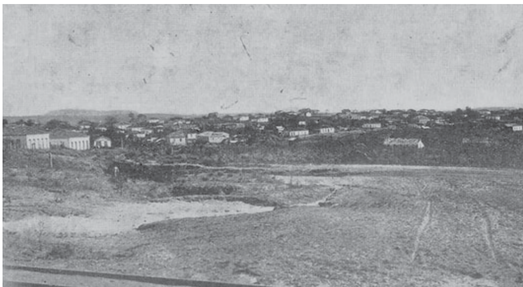
Guardinha em 1922. No ano seguinte, o povoado foi elevado à categoria de distrito do município de São Sebastião do Paraíso, MG.