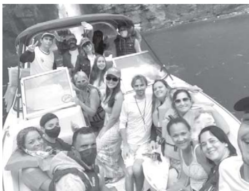
Grupo de turistas de Americana e Santa Bárbara passou pelo local do acidente pouco antes do desabamento