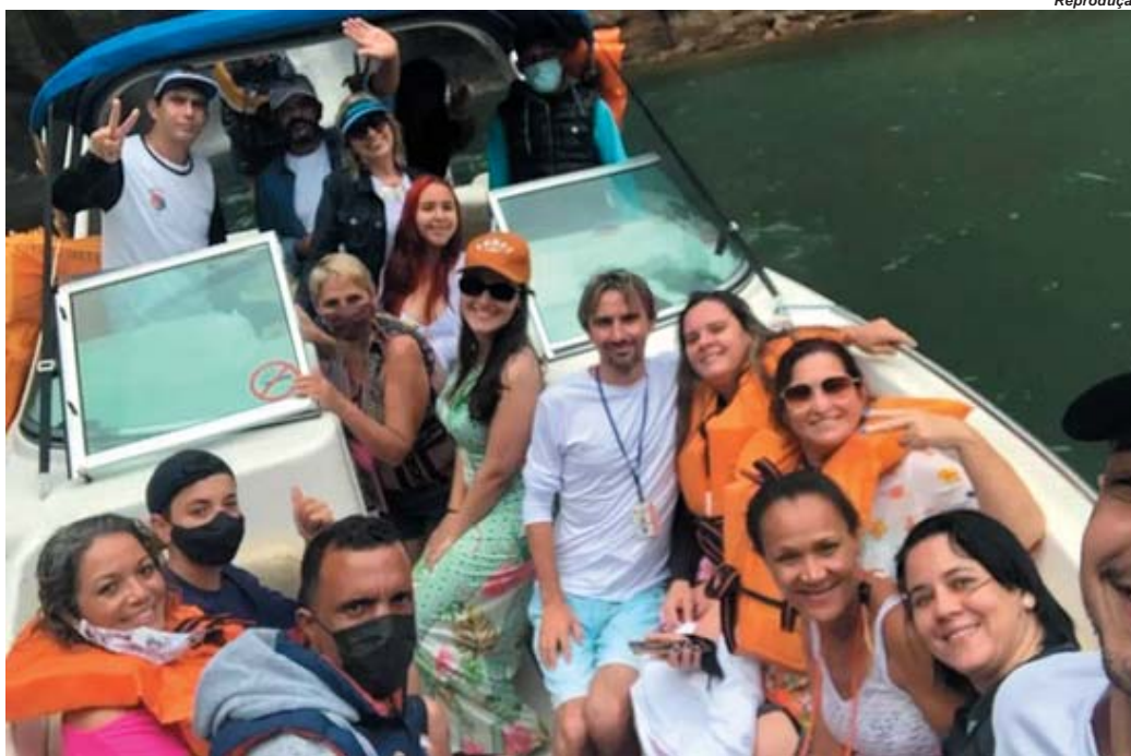
Grupo de turistas de Americana e Santa Bárbara passou pelo local do acidente pouco antes do desabamento

Monte Santo proíbe realização de eventos públicos e particulares