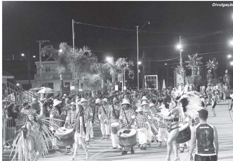
Tenda montada no domingo já está em funcionamento para dar mais conforto no atendimento à população

Também nesta data o município registrava 1.591 recuperados e apenas 56 óbitos confirmados. Em função das notificações 437 pessoas estavam em tratamento domiciliar e não havia nenhum morador da cidade hospitalizado por esta