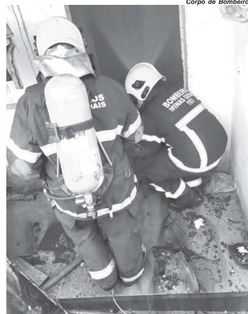
Corpo de Bombeiros