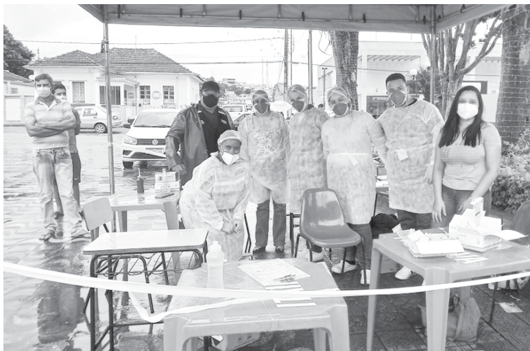
Prefeitura de Jacuí tem intensificado testagem da população sobre a Covid-19

No sábado, 8, a Prefeitura montou uma tenda na Praça Presidente Vargas, onde foram realizados 250 testes, sendo que 48 pessoas testaram positivo. Conforme a secretária municipal de Saúde é preciso a