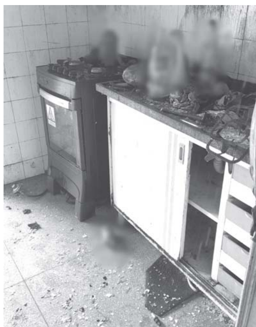
Cozinha da residência ficou destruída, mas nenhuma pessoa ficou ferida

Recomenda-se ainda que nunca utilize dois ou mais equipamentos na mesma tomada, evitando assim que sobrecarga ocasione incêndio na moradia.