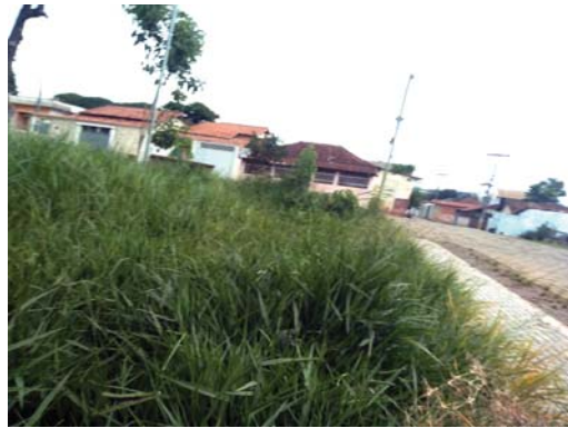
Moradores e frequentadores da Praça Nossa Senhora da Aparecida, mais uma vez reclamam da escuridão e despejo que se encontra esta Praça