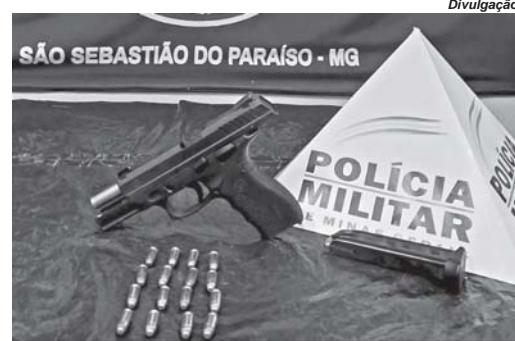
Pistola e munições foram encontradas pela PM com um dos ocupantes do veículo abordado

Durante a busca pessoal, policiais encontraram com o passageiro uma pistola Taurus, modelo PT838, cali-