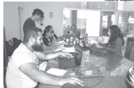
Núcleo de trabalho do IBGE em Paraíso foi montado em uma sala na Câmara Municipal onde os trabalhos são centralizados

O agente destaca que o levantamento será feito até o final de outubro. O trabalho ini-