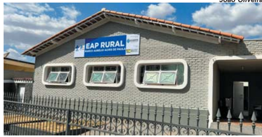
Atendimento será voltado para moradores da Zona Rural com equipe completa, entre médico, enfermeiro, técnico de enfermagem e dentista

A Prefeitura de São Sebastião do Paraíso, por meio da Secretaria Municipal de Saúde, inaugura neste sábado, 6 de agosto, EAP Rural “Marco Aurélio Alves de Paula”, a primeira USF dedicada aos moradores da zona rural que antes eram atendidos no Ambulatório Municipal. Agora esses pacientes irão contar com atendimento continuado e, também, atendimento odontológico. Os atendimentos se iniciam na segunda-feira, 8 de agosto.