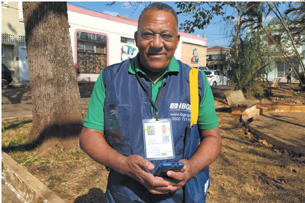
Pesquisadores do Censo 2022 identificados com crachá e colete do IBGE já estão percorrendo as casas de Paraíso