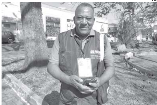
Pesquisadores do Censo 2022 identificados com crachá e coleto do IBGE já estão percorrendo as casas de Paraíso