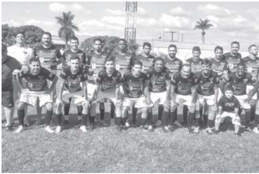
Equipe do Juventude em mantida a tradição de chegar entre as principais equipes da competição

Com o encerramento da primeira fase a Taça Paraíso de Futebol Amador, a Série A voltará a ter jogos em disputa no próximo domingo. A competição que iniciou em abril deste ano tendo a participação de 16 equipes prossegue agora com a semifinal marcada para ocorrer no próximo domingo, 14 de agosto. Oito equipes estarão em campo em busca da classificação para o quadrangular decisivo.