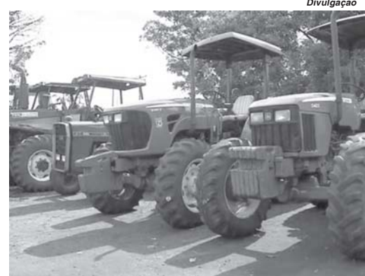
Tratores recuperados após a Operação Pasto Seguro na região onde vários suspeitos foram presos

Os presos foram interrogados e levados inicialmente para o presídio do Jardim Guanabara, em Franca (SP). Conforme a polícia, outros três suspeitos são procurados, entre eles um homem de Ribeirão Preto que seria o líder do grupo. A prática de outros crimes é alvo das investigações. "Sa-