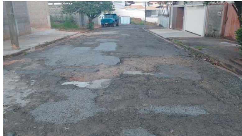
Rua Campos Salles no Jardim Coolapa é só buraco após o outro