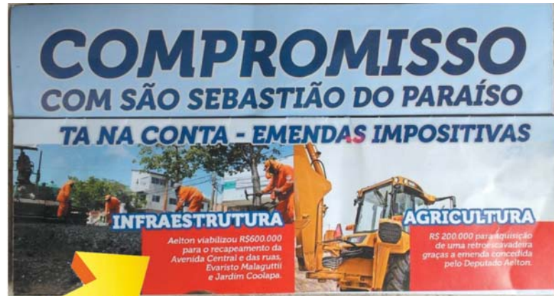
Dinheiro tem que sair DA CONTA pra concertar buracos nas Ruas do Jardim Coolapa