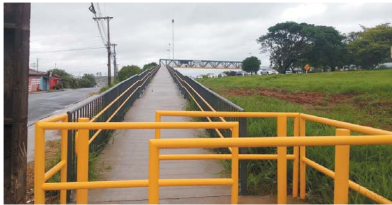
Moradores do Cidade Industrial pedem urgência na iluminação da passarela para pedestres na travessia da BR 491

O "JS" ligou diversas vezes para o telefone 0 800 282050503 disponibilizado para informações ao público pela Nascente das Gerais, mas, semelhante empresas de telefonia que demoram para atender e quando atendem é só jogo de empurra de um departamento para outro, e "deixar como está para ver como fica" até a pessoa desistir da ligação.