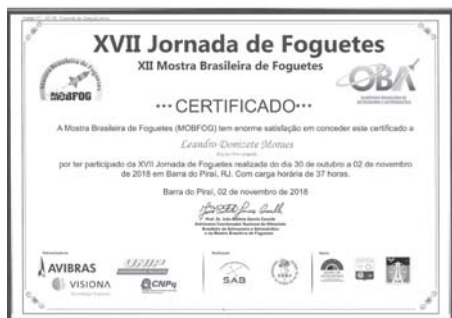
Certificado de Vice-Campeões - Jornada Nacional de Foguetes -