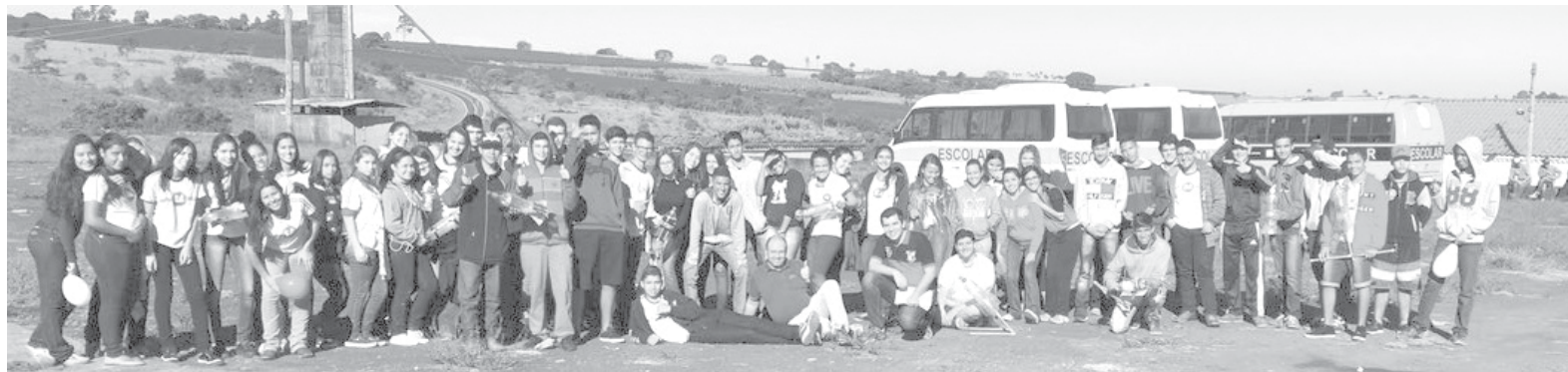
Alunos da Escola Dr. Tancredo participando da classificação em São Tomás