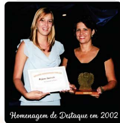
Homenagem de Destaque em 2002