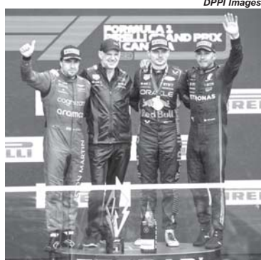
Alonso, Newey, Verstappen e Hamilton, pela ordem, no pódio mais vitorioso da história da F1 no GP do Canadá

Esse binômio quase perfeito tem dois lados: o negativo é fazer com que pareça fácil demais vencer, dando a sensação de monotonia, quando na verdade não é bem assim. Em tudo na vida é preciso às vezes enxergar com outros olhos, e no esporte não é diferente. O GP do Canadá foi uma boa vitrine