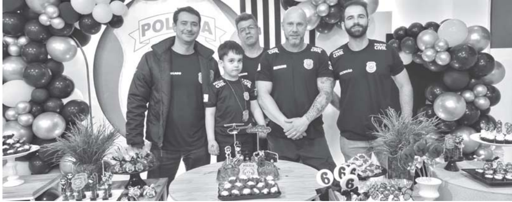
comemorar os seus 6 anos de idade e que, como é apaixonado pela Instituição, escolheu como tema da festa "Po-