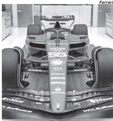
FIA rejeitou pedido de revisão da Ferrari sobre punição a Carlos Sainz na Austrália

A FIA alegou falta de novas evidências apresentadas pela Ferrari para abrir o processo e não aceitou a versão de Sainz alegando que o sol em seu rosto e a baixa