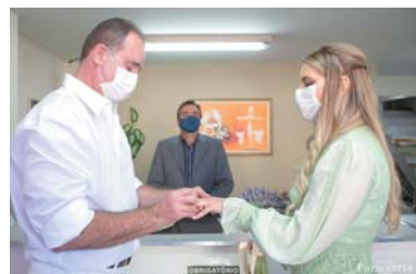
Troca de alianças