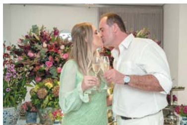
Beijo selou a união