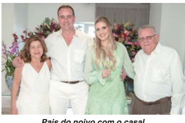
Pais do noivo com o casal