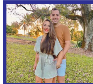
HOJE O CASAL COM OS FILHOS