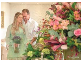
Momento do casal