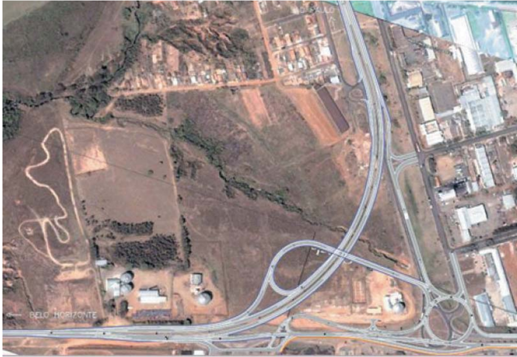
Construção de trevo ligando as duas rodovias vem sendo anunciada a mais de uma década