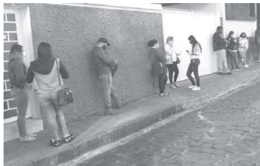
Funcionária da Caixa organizou a fila para evitar aglomeração e também verificando a necessidade de cada pessoa, para agilizar o serviço de atendimento