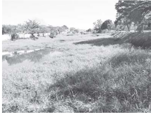
Novamente moradores pedem limpeza de matos nas represas do San Genaro