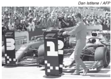
Uma das cenas do ano: Vettel tira a placa 1 do carro de Hamilton e coloca a 2. A coluna POLE POSITION deseja um Feliz Natal a todos os leitores do JS

Pra não perder a conta, no Azerbaijão outra dobradinha dos carros prateados, agora com Bottas fechando à frente de Hamilton numa corrida em que a Ferrari se perdeu na estratégia. Na metade da prova, uma cena de pastelão protagonizada por Daniel Ricciardo (Renault) que se enroscou com Daniil Kvyat (Toro Rosso), deu ré e acertou o russo(!). E só dava Mercedes para desespero de