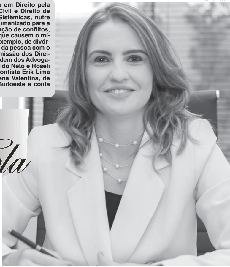
Lidiane é advogada especialista em Direito da Família

L.C.B.: Sim, é um mero facilitador nessas relações de conflito, ele não pode se envolver emocionalmente, sempre se norteando pelos princípios éticos da advocacia. A mediação de conflitos e essa prática da advocacia sistêmica vêm para mostrar que existe uma falta de comunicação entre as pessoas, e que essa falta de comunicação é que geram os conflitos, mas que a gente pode recomendar e dar um lugar de respeito para cada um dos envolvidos e estabelecer o diálogo. Temos que ser o intermediador entre o conflito para que as partes voltem a dialogar pelo menos para definir as coisas bá-