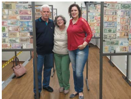
Projeto será retomado em 2020 com possibilidade de realização de palestras nas escolas e exposição na região