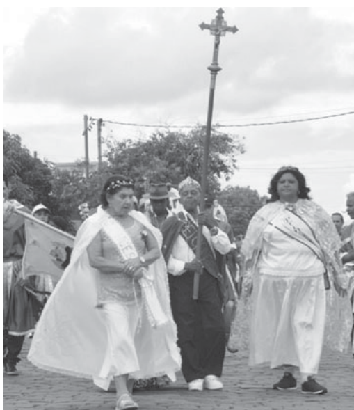
Congada 2019 teve início dia 8 de dezembro com solenidade do Levantamento das Bandeiras