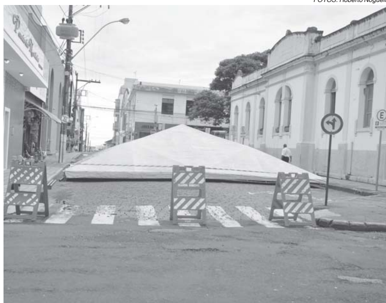
Com a instalação das tendas parte do trânsito será interrompido no centro da cidade

NOVIDADES Através de um Termo de Ajustamento de Conduta (TAC) assinado pela associação, juntamente com a Polícia Militar e a Guarda Municipal, ficou acertado que os desfiles serão encerrados às duas horas da manhã com tolerância de mais 30 minutos. Tem também outros detalhes como autorização dos pais ou responsáveis que deve ser expressa, por escrito, autorizando crianças desfilarem.