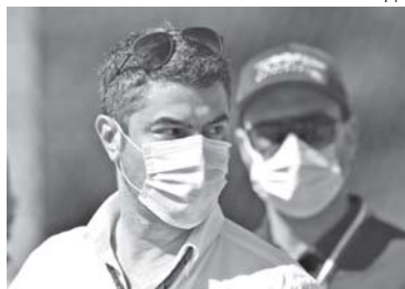
Michael Masi não estava preparado para cargo tão importante e de responsabilidade na F1

Michael Masi se perdeu no turbilhão de acontecimentos. Faltou pulso para tomar decisões sem pender para nenhum dos lados quando pressionado. Uma semana antes, em Jeddah, ele escancarou suas fragilidades com decisões estranhas. Negociou a devolução de posição de Verstappen, deu bandeira vermelha logo no começo da corrida para que a barreira de pneus fosse consertada após a batida de Mick Schumacher quando o ideal era manter o Safety Car na pista. Tal atitude quase arruinou com a corrida de Hamilton que havia acabado de trocar os pneus, e beneficiado Verstappen que arriscou ficar na pista, e com a paralisação pode colocar pneus novos e se manter na liderança. A sequência das manobras de Verstappen X Hamilton culminaram com várias outras decisões equivocadas. Mas, domingo passado, em Abu Dhabi, Masi pisou feio na bola. Logo na primeira volta entendeu que Ha-