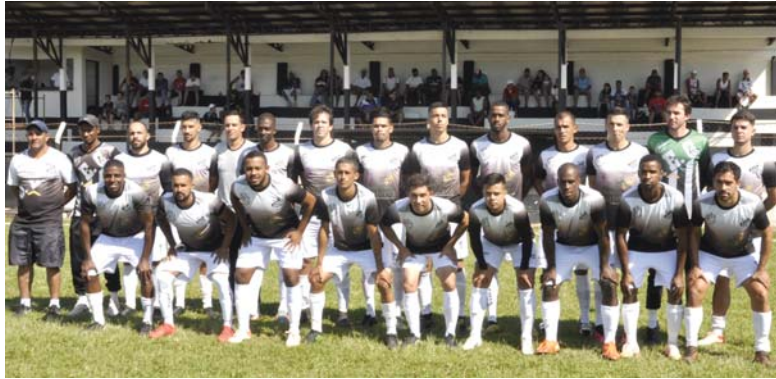
Alvinegro teve a chance de sair em vantagem na semifinal e agora decidirá vaga no interior paulista

O Operário Esporte Clube deixou escapar a vitória contra o Clube Atlético Cravinhos e cedeu o empate para a equipe do interior paulista nos acréscimos, no domingo (3/7). Na partida disputada no Estádio Dr. Joaquim Ferreira Gonçalves, válida pelo jogo de ida da semifinal do Campeonato Regional Amador, o Falcão Negro por pouco derrubou a invencibilidade do adversário.