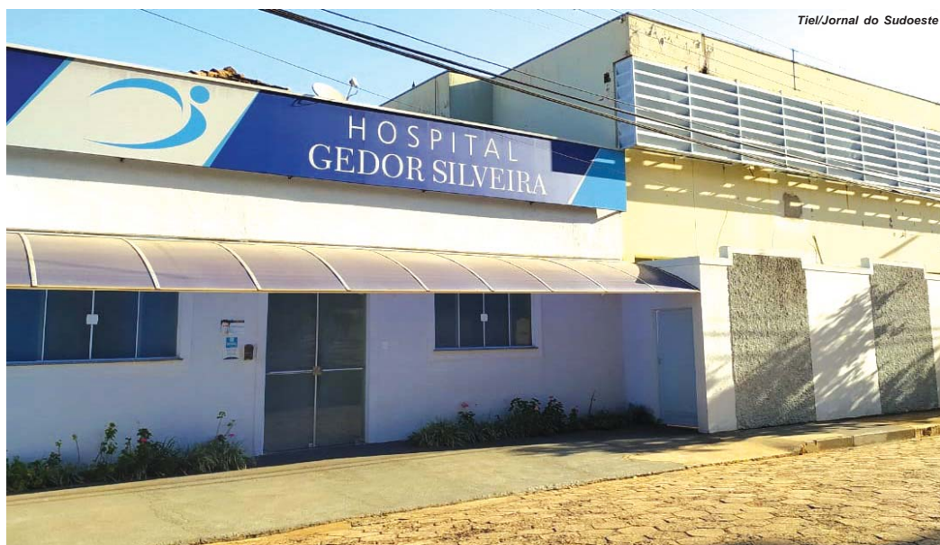
Tiel/Jornal do Sudoeste

Câmara de Paraíso sedia Microplenária Regional do Parlamento Jovem