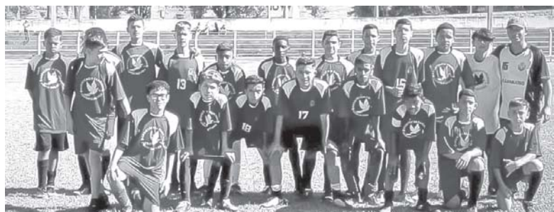
Times das equipes de base treinadas em projetos da Secretaria de Esporte da Prefeitura de Paraíso fizeram partidas amistosas em Jacuí

A equipe do sub-11 venceu o time da casa por 4 a 0; o Sub-13 por 2 a 0, o Sub-15 por 2 a 1. Já a categoria Sub-17, que fez seu primeiro amistoso, foi derrotada por 1 a 0.