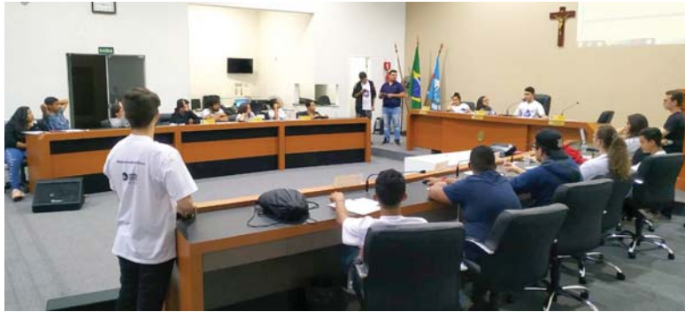
Legislativo de Paraíso recebe nesta quarta-feira estudantes da região para a Microplenária do Parlamento Jovem de Minas