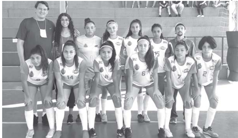
Meninas da E.E. Paraense sagram-se campeãs e conquistaram a Medalha de Ouro

Depois de passar por outras adversárias as meninas de Paraíso chegaram a final e na decisão fizeram uma grande apre-