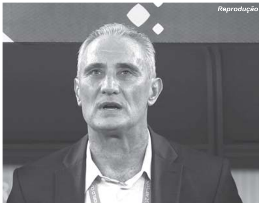
Por Rodrigo Ricardo Repórter da EBC RIO DE JANEIRO

Treinador comandou equipe masculina por seis anos e meio