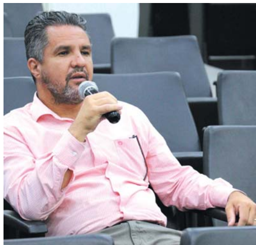
Prefeito Marcelo Moraes

Outro dado apresentado pelo secretário foi a redução da dívida existente em relação às rescisões de administrações anteriores, que até 31 de dezembro era R$ 1.784.954,51 – já tendo sido pagas até 31 de agosto deste ano mais de R$ 380 mil.