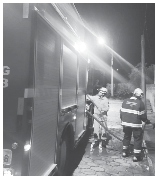
Incêndio foi registrado no sofá e se alastrava para outras áreas da residência

Os bombeiros conseguiram extinguir o incêndio utilizando aproximadamente 500 litros de água de um caminhão autobomba tanque salvamento e impediram que o fogo se alastrasse para outros cômodos. Simultaneamente ao combate do incêndio foi feita ventilação do local, devido concentração de fumaça no ambiente. Du-