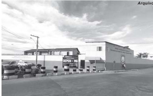
Presídio de São Sebastião do Paraíso é uma das unidades com interdição judicial segundo relação do MP