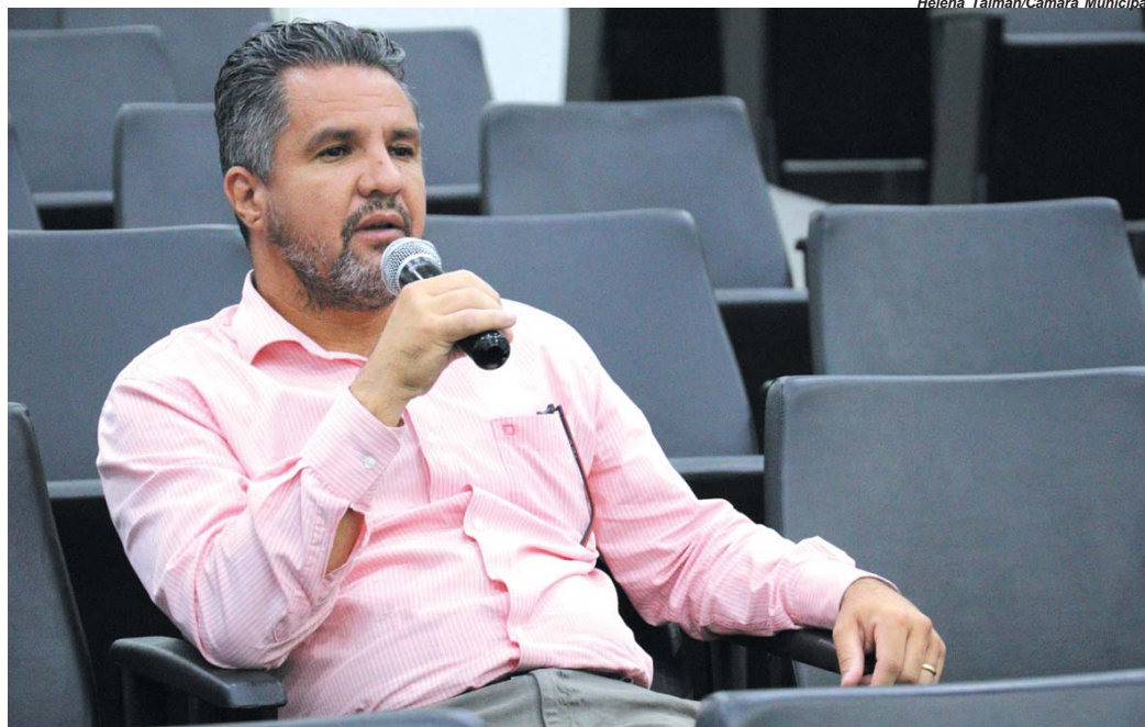
Prefeito Marcelo Morais