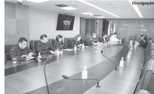
Reunião entre promotores e representantes do Governo de Minas busca soluções para os presídios no Estado

O Ministério Público de Minas Gerais (MPMG), por meio do Centro de Apoio Operacional das Promotorias de Justiça Criminais (CAOCrim), e o Governo do Estado se reuniram para iniciar tratativas e elaborar um plano de ação que fortaleça o sistema penitenciário no estado. A iniciativa tem por objetivo reestruturar e sanar os problemas existentes atualmente nas unidades prisionais mineiras. O presídio de São Sebastião do Paraíso está na lista entre as unidades que deverão ser atendidas e onde são registrados problemas estruturais.