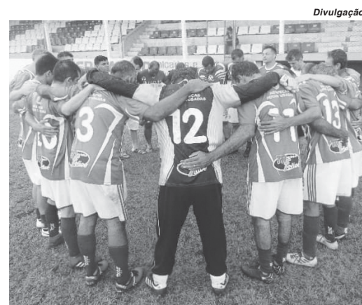
Paraisense entra em campo para defender com favoritismo vaga na final contra o Operário

A outra vaga terá a sua definição neste sábado, 15. A partir das 15 horas, no Estádio