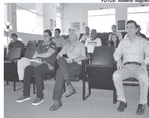
Durante a reunião do conselho rural foram tratados de vários temas ligados ao setor agropecuário