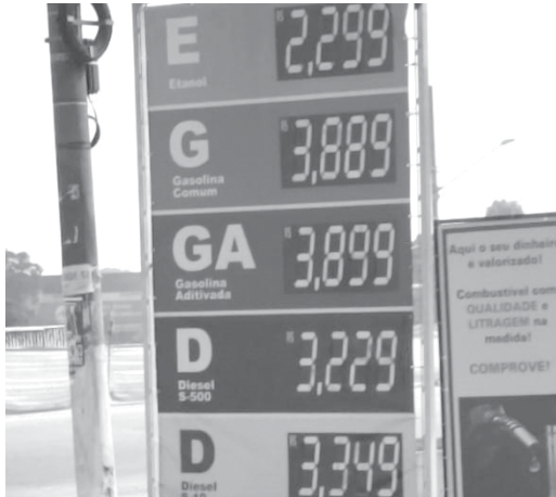
Consumidor Paraisense aproveitou a viagem e abasteceu seu carro flex, pagando R$3,88,9 no litro da Gasolina, no Posto Stratus em Guarulhos-SP

O prefeito de Uberaba está de parabéns ao dispor-se ir a