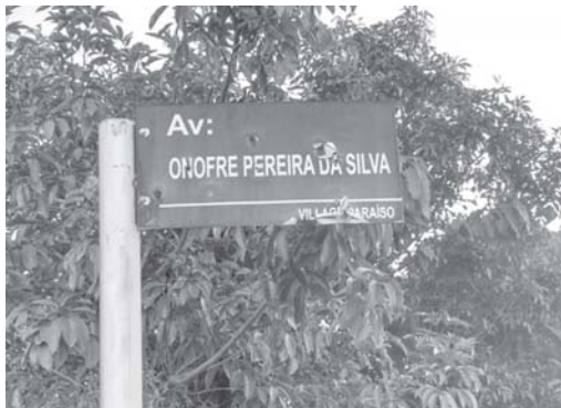
No Loteamento Village Paraíso esta placa de denominação de Av. Foi perfurada por vários disparos de arma de fogo

Este grave problema de vandalismo tem acontecido em diversos novos loteamentos no perímetro urbano de Paraíso, onde são vistos vários "postinhos" arrancados. Há pouco tempo o "JS" publicou