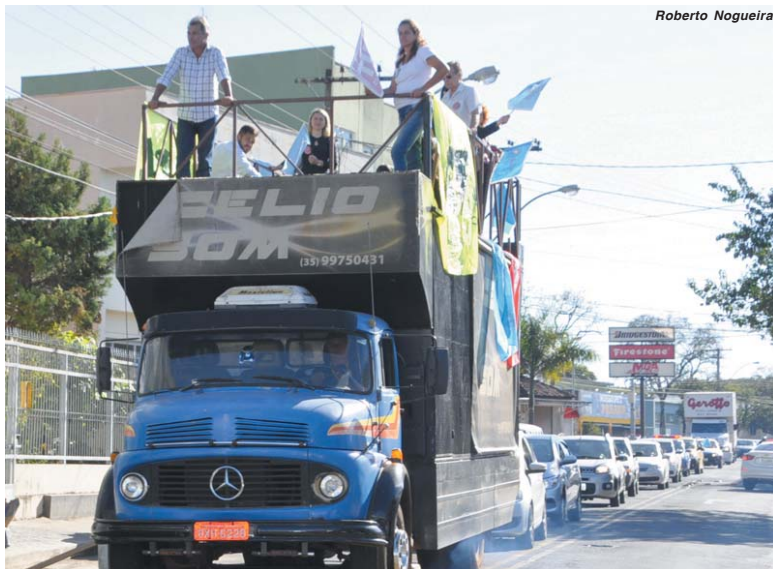
Servidores usam carro de som e fizeram carreta pela cidade falando sobre impactos da Reforma