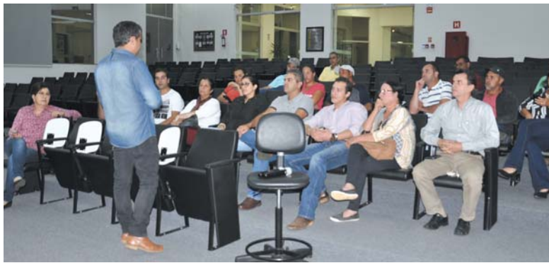
Durante o lançamento do programa foram apresentados números já alcançados pelo Mais Genética

O Programa Mais Genética, está disponível para o produtor de leite no município de São Sebastião do Paraíso, desde meados desta semana. A iniciativa tem por objetivo oferecer melhoria na qualidade genética de bovinos com a oferta de um banco de sêmen e toda estrutura para a inseminação.