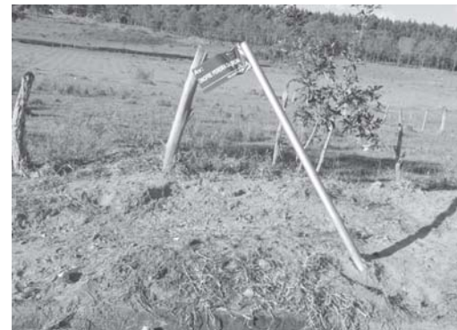
Vejam o que os vândalos aprontaram com este poste e placa de denominação de uma Avenida no Village Paraíso

matéria a respeito. No entanto não há informações se algum vândalo foi identificado e preso por esta prática danosa.