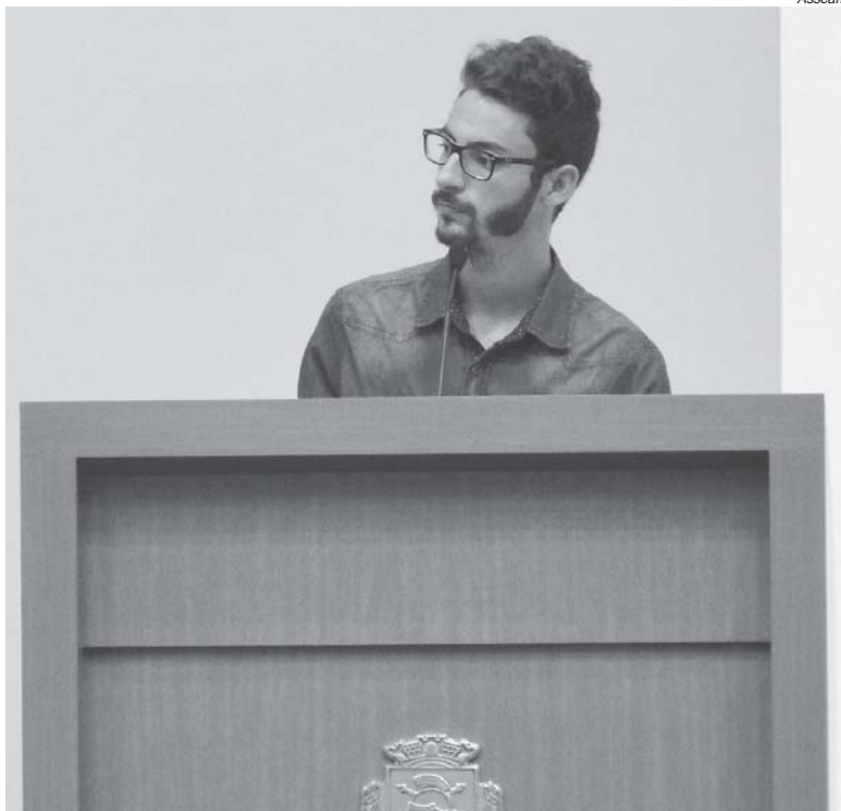
Professor Thales fez sugestões do que pode ser feito na lagoa do San Genaro

"Vamos elaborar esse projeto, recolher assinaturas dos moradores, convidado todos os vereadores que tenham ideias