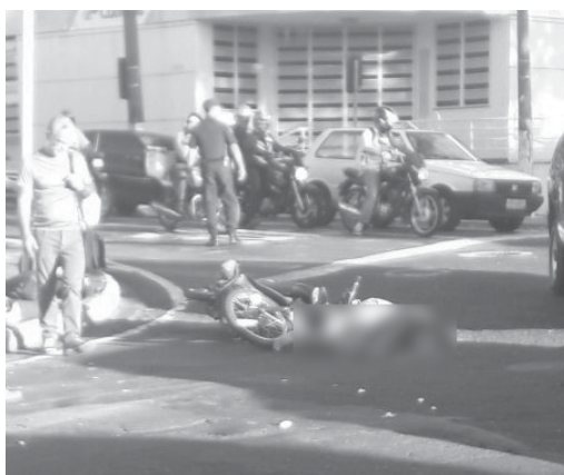
Jovem estudante teve morte instantânea após envolver-se em acidente de trânsito em Franca, foi sepultada em Paraíso

COMOÇÃO E SEPULTAMENTO A notícia da morte de