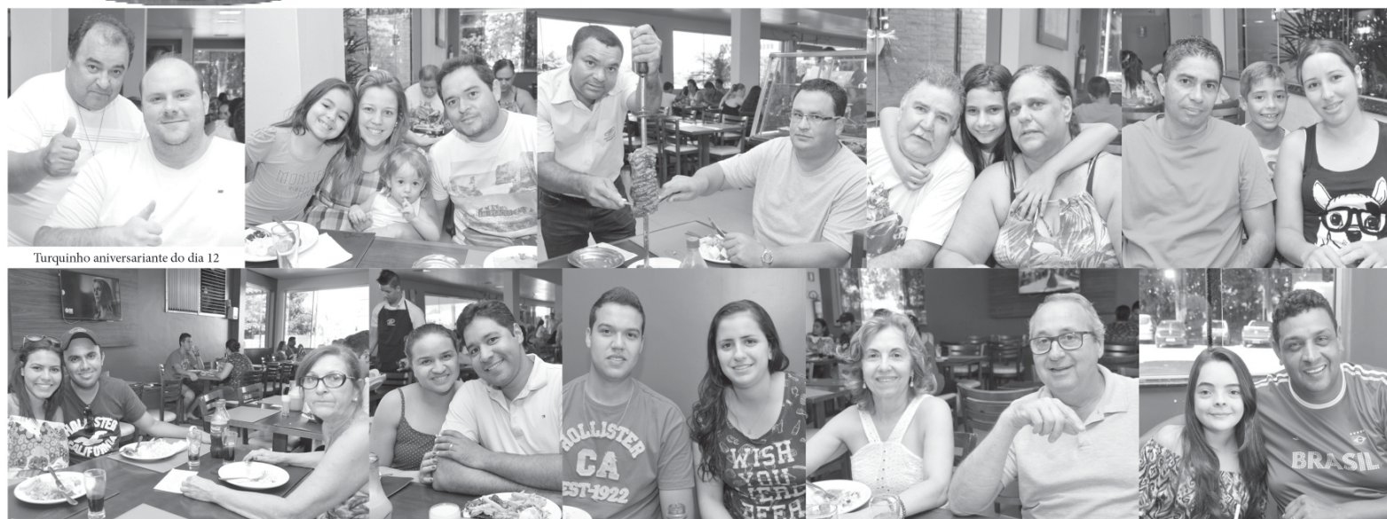
Turquinho aniversariante do dia 12

Como de costume, todo domingo registramos o tradicional almoço na Churrascaria Zambiasi. Rodízio ou self-service, leitão assada e variedade em saladas, pratos quentes e sobremesas. Irresistível! Aberto diariamente. Atendimento nota dez, amplo e moderno espaço com playground. Aos sábados peixe à parmegiana. Aceita-se reservas para festas e confraternizações. Rodovia MG 050 Trevo saída para Itaú de Minas e com o telefone 3531-1518. E essa são as fotos do domingo, (12/03).