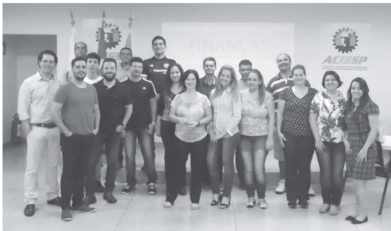
Por Heloisa Rocha Aguiaras

A Associação Comercial, Industrial, Agropecuária e de Serviços de São Sebastião do Paraíso (Acissp) e a Libertas – Faculdades Integradas se unem para implantar o curso de MBA em “Gestão Empresarial”. As inscrições já estão abertas e as aulas devem começar em maio.