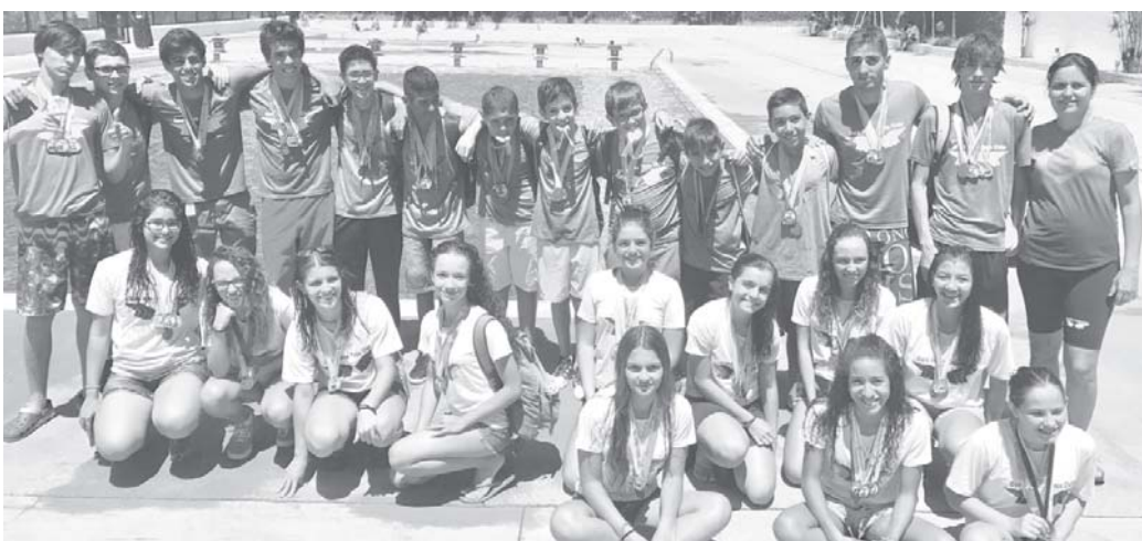
Por Heloisa Rocha Aguiaras

A equipe de Natação do Ouro Verde Tênis Clube trouxe 70 medalhas da 1ª Etapa da Copa MG regional realizada no domingo, (12/3), em Poços de Caldas. Esse resultado foi conquistado por 24 atletas.