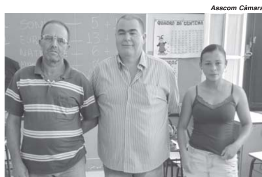
Membros eleitos para o Conselho Distrital da Guardinha deverão ser empossados pelo Executivo

O Conselho Distrital pode ser considerado um espaço de poder da cidadania interativa, que atua de forma integrada com os demais poderes. Os artigos 180 ao 189 da Lei Orgânica Municipal (LOM) falam sobre a possibilidade de existência de um Conselho Distrital. Os membros do Conselho