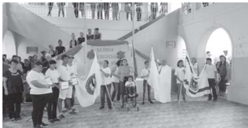
Semana Educação para a Vida