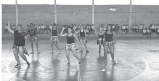
Apresentação de Dança aniversário da Escola