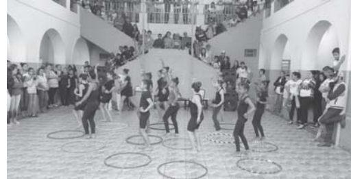
Projeto Circo Social