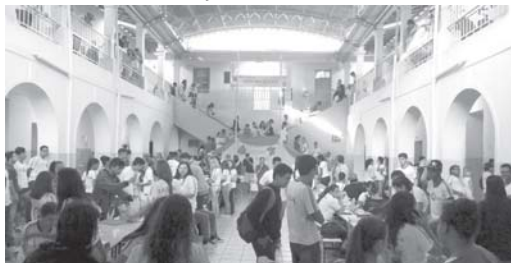
Feira de Ciências