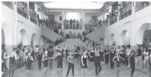
Projeto Circo Social