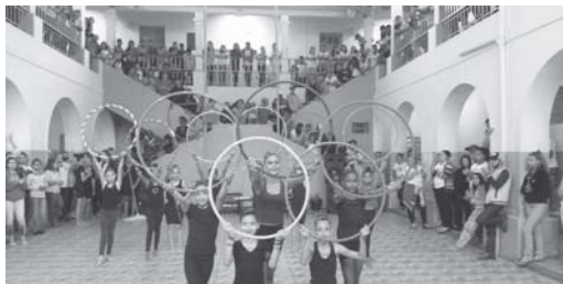
Projeto Circo Social