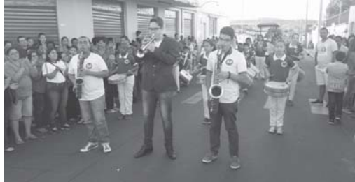
Fanfarra no 7 de Setembro