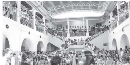
Escola Dr Tancredo U.H.T Festival 8ª Edição