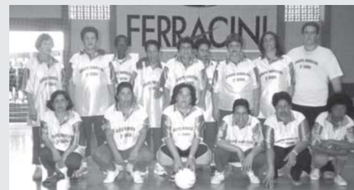
Time feminino de voleibol da 3ª idade - RENASCEM