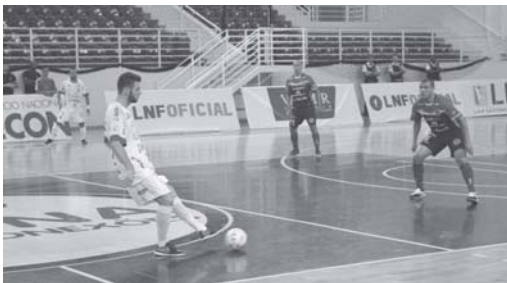
Intelli Paraíso e Pato Futsal

A equipe da Intelli/Paraíso Futsal foi derrotada por 4 a 2 pelo Pato Futsal, de Pato Branco (PR), na sexta-feira (31/3) na partida de estreia da Liga Nacional de Futsal 2017. Mesmo jogando em casa, na Arena João Mambri, o time local foi surpreendido pelos visitantes que marcaram logo no início do jogo e conseguiram manter-se à frente no placar no primeiro tempo. Os paraenses aperaram a marcação na etapa final, mas não conseguiram um melhor resultado. A próxima partida será dia 14 diante do Marreco, de Francisco Beltrão também do Paraná.