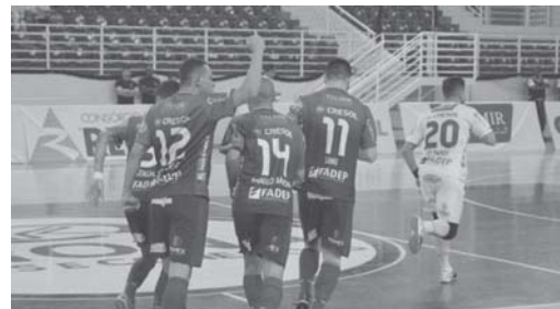
Pato Futsal estreia com vitória na LNF edição 2017