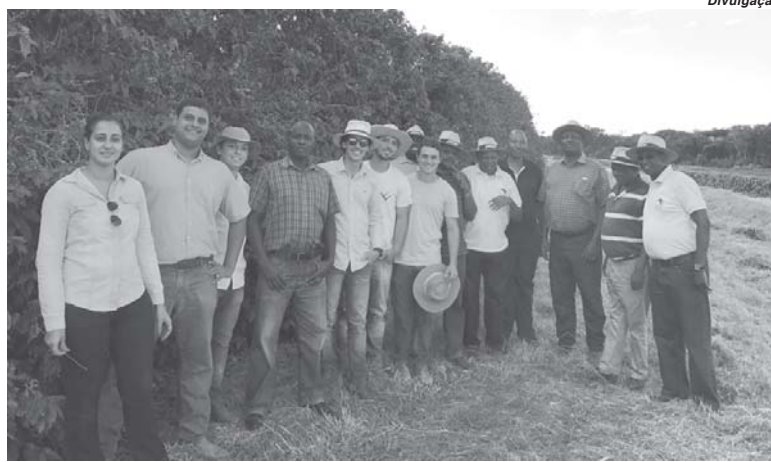
Quenianos visitaram lavouras de café do Sul de Minas