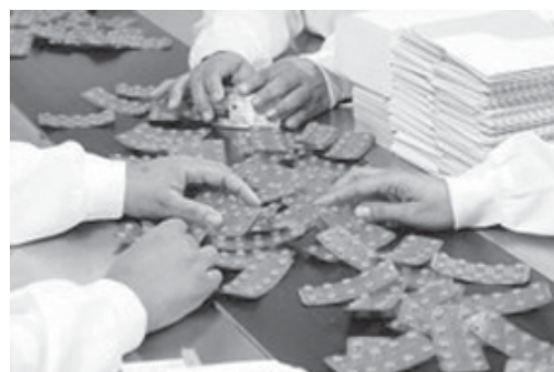
Registro do produto biológico Xultophy é inédito no Brasil e foi aprovado nesta segunda-feira (3) pela agência

Na última segunda-feira (27/3), a Anvisa aprovou o registro do genérico dapagliflozina, também utilizado para o tratamento de diabetes tipo 2.