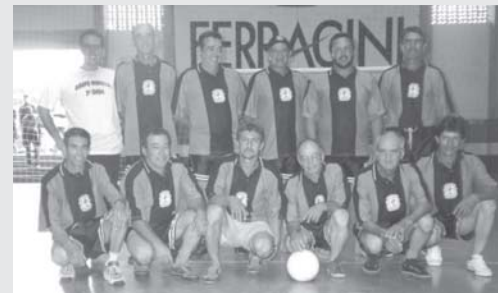
Time masculino de voleibol da 3ª idade - RENASCEM