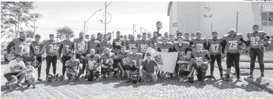
Equipe de Paraíso de futebol americano fará estreia na competição no próximo final de semana

A equipe do Unimed/Paraíso Miners de São Sebastião do Paraíso vai estreiar no próximo domingo (9/4), na primeira edição da Copa Minas de Futebol Americano. A competição foi iniciada no domingo (2/4), e a competição tem a participação de seis times do Estado que estão divididos em duas chaves. O time local está no grupo do Triângulo Mineiro junto com Uberaba e Araxá.