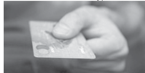
Mudança obriga instituições a transferirem para o crédito parcelado, com taxas menores, os valores do rotativo não quitados em 30 dias

Consumidor que não conseguir pagar integralmente a tarifa do cartão de crédito ficará apenas por 30 dias no rotativo do cartão.